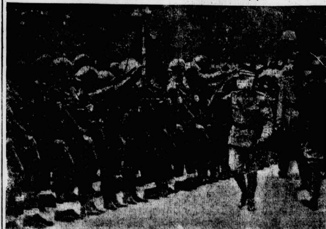
In Neapel fand die Parade der italienischen Spanien-Freiwilligen statt, die der König und Kaiser Viktor Emanuel selbst abnahm.