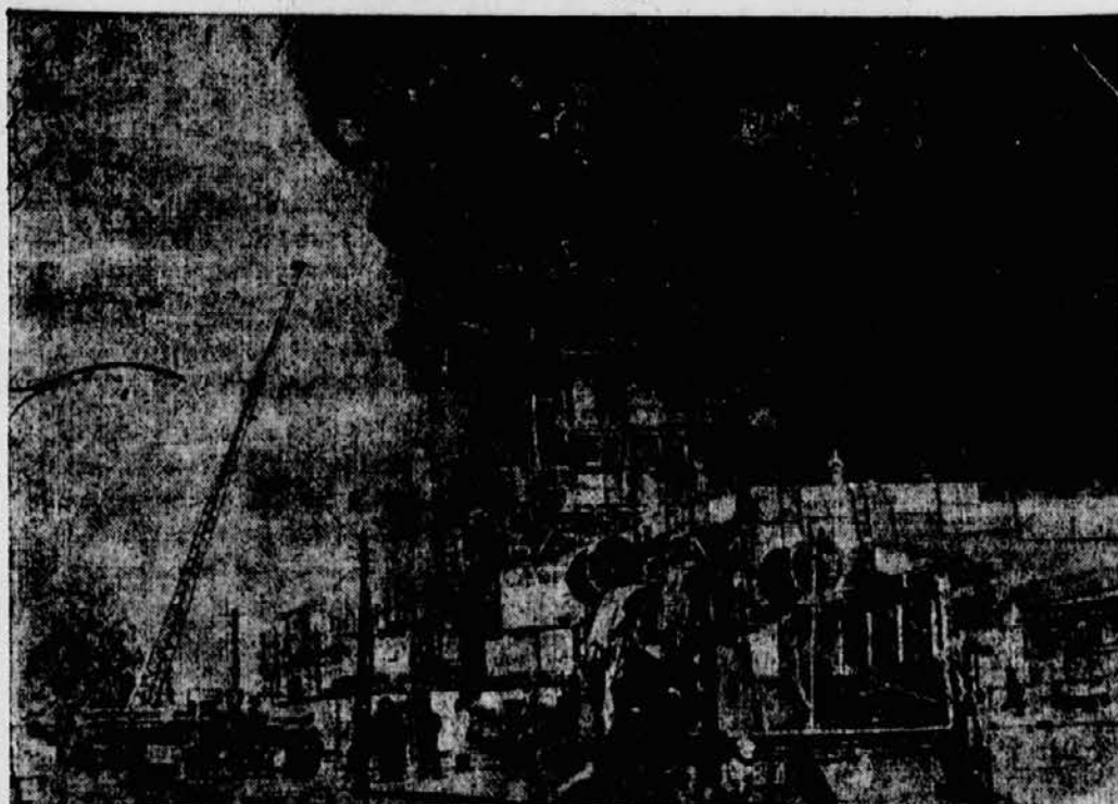
Durch eine der größten Brandkatastrophen, die die polnische Hauptstadt jemals erlebt hat, wurde der Hauptteil des neuen Hauptbahnhofes, an dem seit vielen Jahren gebaut wurde, von den Flammen vernichtet. — Ein Blick auf die Unglücksstätte während des Brandes.