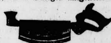
Die neue Nut- und Fugensäge.

Die gewöhnliche Fugenbreite, die mit dieser Säge geschnitten wird, beträgt 5 mm; durch Einlegen mittelgefertigter Ab-