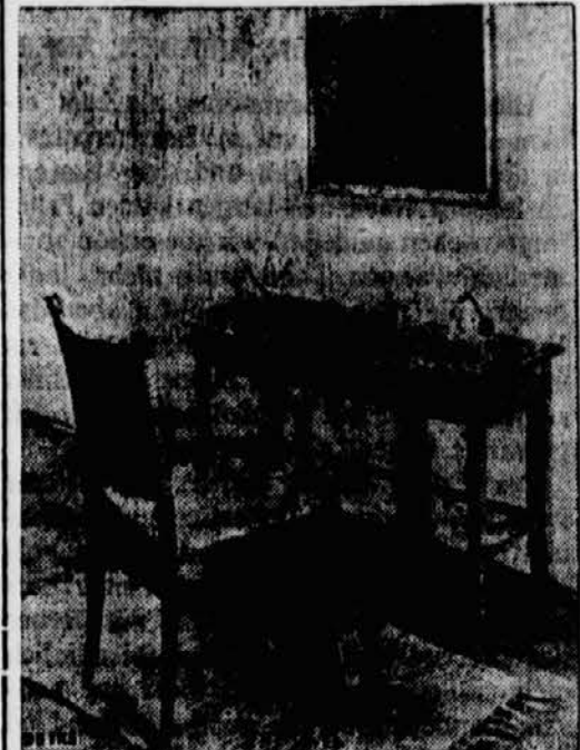
Der Toiletentisch der modernen Frau.

Und nun achten Sie auch noch auf den Spiegel, der über dem Frisiertisch hängt. Er ist, auf dem Bilde nicht genau zu sehen, quadratisch mit einem hübschen klei-