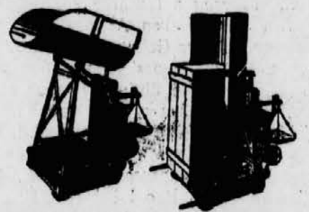
Die neue Kippmulden-Vorrichtung für Dezimalwaagen. Links in Gebrauchstellung rechts in heruntergeklapptem Zustand, um Stückgüter verwiegen zu können.

Auf einem zusammenklappbaren Gestell aus stabilem Winkel- und Bandeisen erhebt sich eine Stahlblechmulde, die in oben offener oder geschlossener Ausführung lieferbar ist. Während die oben offene Ausführung zum Verwiegen von Getreide, Kartoffeln, Mehl, Kohlen oder Koks und dergleichen gedacht ist, wird die ge-