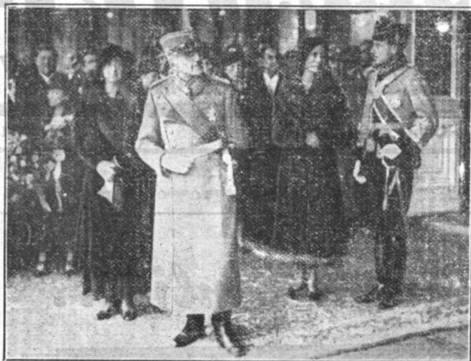
Nj. Vel. kralj in kraljica, knez Pavle in kneginja Olga čakajo na peronu beograjskega kolodvora na prihod bolgarske kraljevske dvojice