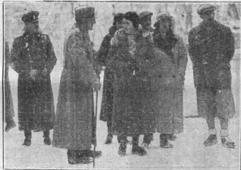
Kraljevski gosti na lovu v Petrovcu (z desne na levo): Kralj Boris, naša kraljica Marija, princ Ciril, kraljica Ivana v razgovoru z našim kraljem