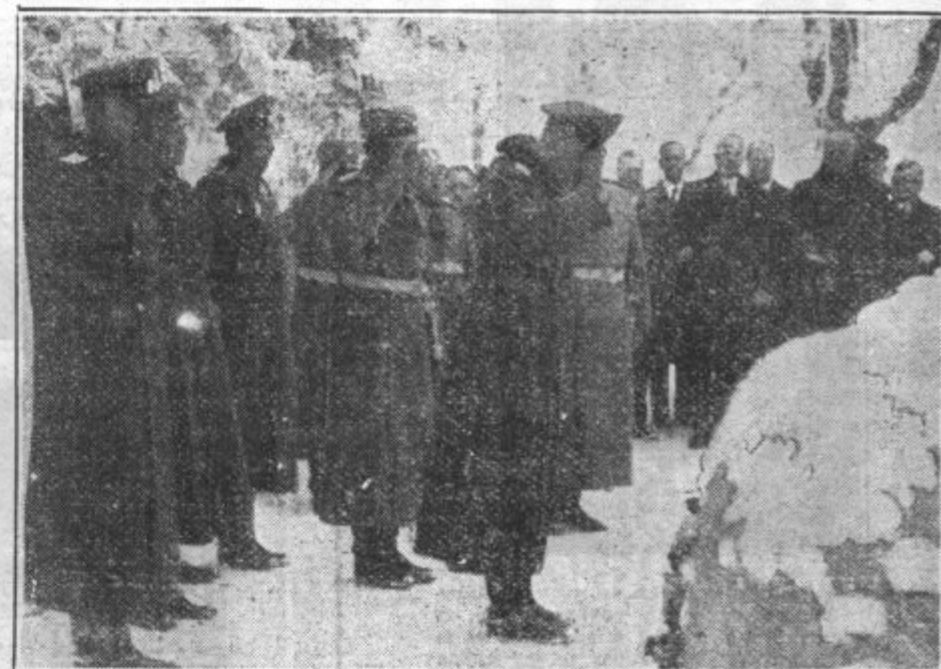
Nj. Vel. kralj Boris in kralj Aleksander s spremstvom pred grobom Neznanega vojaka na Avali

Biti si moramo na jasnem, da to delo še ne bo lahko in ne kratkotrajno. Premočne so še sence prošlosti, ki še padajo v sedanost, in marsikak oblak zna še zakriti solnce, ki je začelo vzhajati letos. Toda čut slovanskega bratstva, z vso močjo prebujen v zadnjih mesecih, in vedno jasnejše spoznanje resničnih interesov lastnega naroda, se bosta odslej tudi v Bolgariji lahko uveljavljala hitreje in z večjim učinkom.