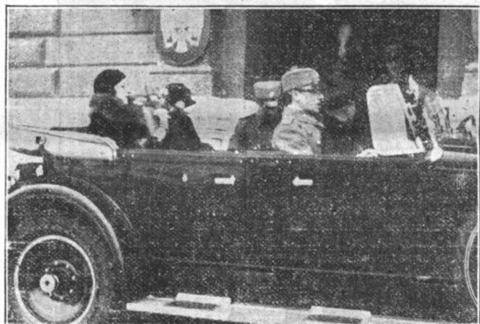
Nj. Vel. kraljici Marija in Ivana (s šopkom v naročju) v avtomobilu pred beograjskim kolodvorom