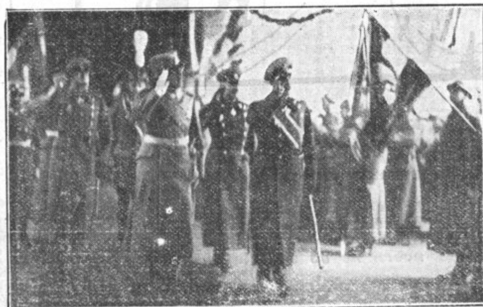
Nj. Vel. kralja Aleksander in Boris odzdravljata častni četi naše vojske, postavljeni na kolodvoru

Ob posetu bolgarskega kralja Borisa na slavnostni večerji izrekla zdravico Nj. Vel. kralj Aleksander in kralj Boris. Prvi je spregovoril