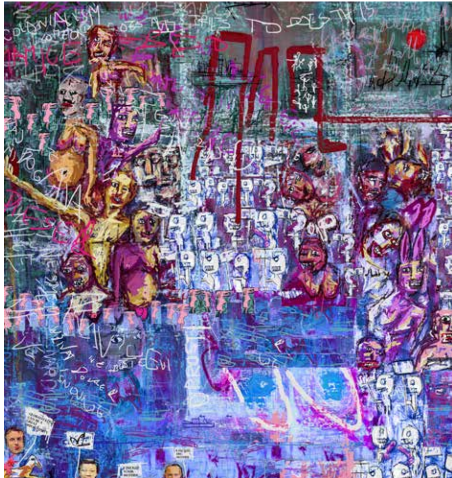
Velika masovna rit, 2022, digitalni print, 70 × 50 cm