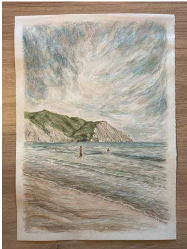
V oceanu, 2023, suhe barvice, akvarel, papir, 29,5 × 21 cm