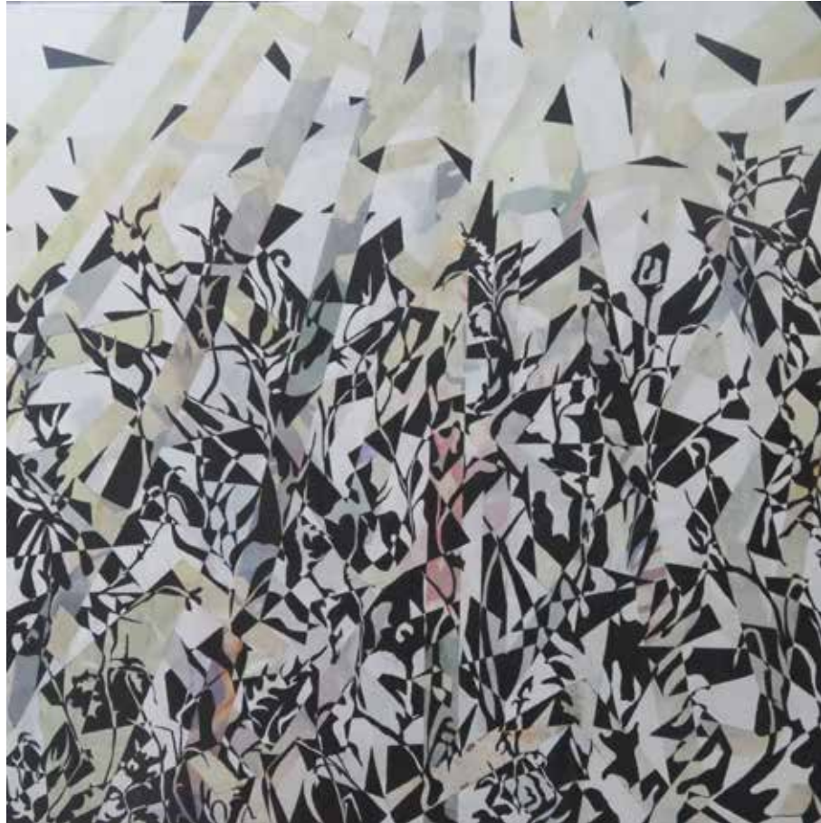
Kaleidos, 2022, tuš, akril, 120 × 120 × 2 cm