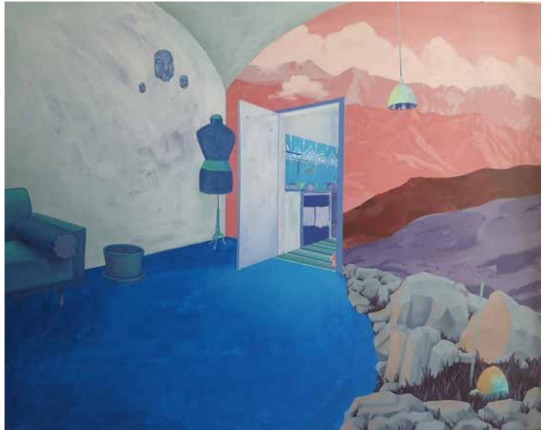
Mama, kje si?, 2022, akril, platno, 120 × 150 cm