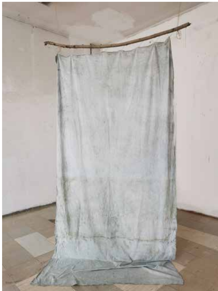
Transience Of Simulation, 2023, naravno barvan bombaž, drevesna veja, vrvica, 250 × 160 cm