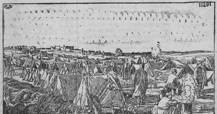
Lager der geflüchteten serbischen Truppen auf Korfu.

Za časa zmagovitih naših bojev na Srbskem in v Albaniji bilo je jedro srbske armade uničeno. Le par tisočev nam tako strupeno sovražnih, vendar pa junaških čet zamoglo se je rešiti pred uničenjem. Grozovita kazen božja zadelja je srbsko kraljemorilsko državo; vsled vse-slovanskega fanatizma voditeljev te zločinske države moralo je srbsko ljudstvo skoraj poginiti. Listi prinašajo grozovite posameznosti o koncu poražene srbske armade. Na tisoče napol otročjih mladeničev, preoblečenih v srbske uniforme, pomrlo je od lakote in napora. Kakor rečeno, rešilo se je le par tisočev srbskih vojakov. Njih zavezniki an-