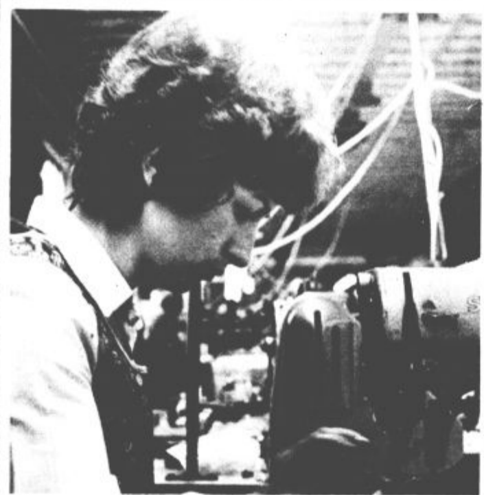
Zgradili bodo nove proizvodne prostore

Delavci Elkroja — tozd Konfekcija Šoštanj so v prvem tromesečju letos dosegli neprimerno boljše poslovne rezultate kot v enakem obdobju lani.