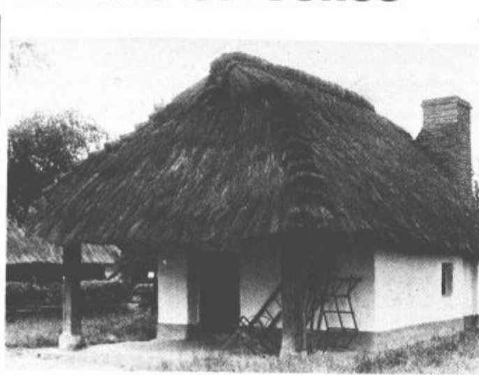
Panonska vas, ena od zanimivosti Madžarske

Pot nas je vodila nato do Blatnega jezera in do krajev, kjer naj bi nekoč bilo središče Koceljeve kneževine. Poleg številnih znamenitosti, lepih dvorcev in utrdb smo si ob povratku v Porabju ogledali še „skanzen“ — Panonsko vas. To je muzej na prostem, kjer so zbrane stare panonske domačije in predstavljena