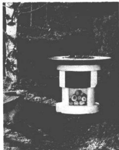
Vrtni kamin Vrba

V dnevni sobi je prijetneje, bolj domače in bolj romantično, če je v njej tudi kamin. V Gradnji izdelujejo kamine Antika in Smreka. Čar odprtega kamina je bil vedno v njegovem zunanem izgledu. Suhoiparna tehnična popolnost pri sodobnih gradnjah stanovanj še podžiga želje po estetskem videzu. Dopolnjevanje centralnega ogrevanja z odprtim kaminom nam pomaga ustvariti tako ozračje in ugodje, ki si ga želimo, primerno vremenu in času. V Gradnji v Latkovi vasi pa so pričeli proizvajati tudi vrtno kamine. Dva tipa proizvajajo: Vrba in Breza. Poleg lepote in praktičnosti se odlikujeta tudi po tem, da lahko elemente stikate brez uporabe malte, kar omogoča postavitev oziroma prestavitve kamina na poljubno mesto atrija, vrta, terase... Kamina imata možnost izvedbe kot grill kamin ali grill mizica.