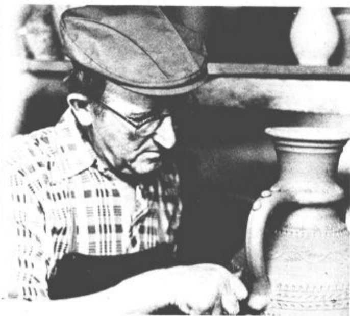
Spretni prsti naglo oblikujejo mehko glino