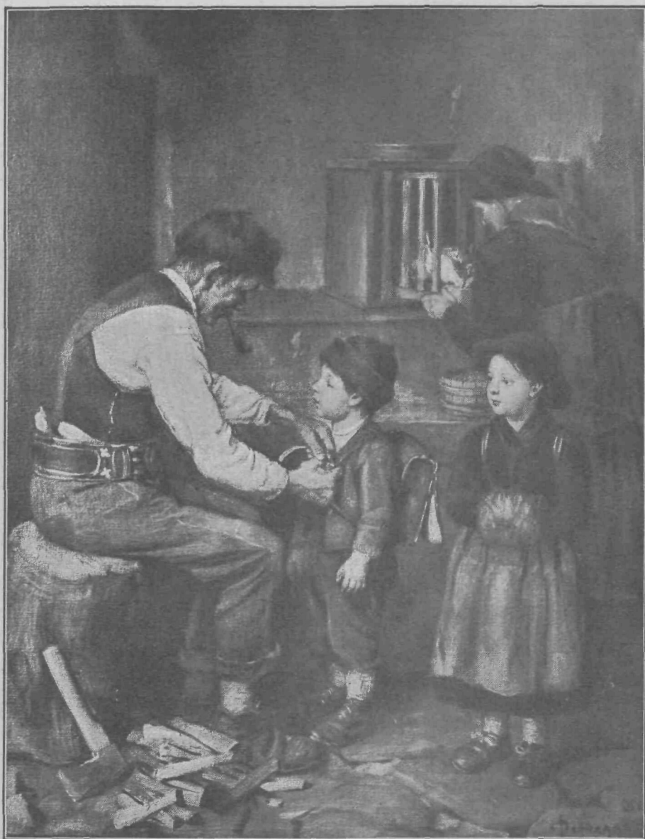
V šolo se odpravlja