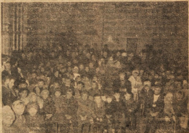
Dedek Mraz je privabil v dvorano veliko najmlajših »cinkarnarjev«. Dvorana je bila polna — bolj kakor ob kakki proslavi.

Pravlični program so pripravili učenci IV. osnovne šole pod vodstvom tovarišic: Joštove, Lahove in drugih.