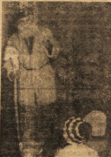
Dedek Mraz je prišel!

Mesec december je za naše najmlajše mesec želja in pričakovanj; skoraj vsi sprašujejo: kdaj bo prišel dedek Mraz, kaj mi bo prinesel, ali inna še vedno tako lepo, dolgo belo brado in podobno. Najmlajše »cinkarnarje« je dedek Mraz obiskal v torek, 27. decembra.