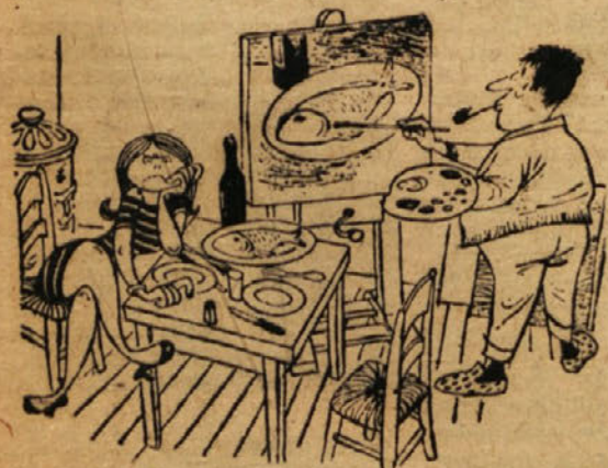
— Pohiti in dokončaj že enkrat to svoje tihožitje! Strašno sem lačna.

Pri nakupu stanovanjske hiše pa moramo še pripomniti, da kupnina ne sme biti manjša od dveh tretjin prometne vrednosti stanovanjske hiše, oziroma ne sme biti manjša od gradbene, knjigovodstvene cene, ker je lahko v nasprotnem primeru pogodba o nakupu razveljavljena. Nedograjeno — neuseljeno stanovanjsko hišo, ki ni vnese-na v fond stanovanjskih hiš, lahko gospodarska organizacija proda. Medtem ko morajo biti zgrajene stanovanjske hiše vložene v fond stanovanjskih hiš podjetja za gospodarjenje s stanovanjskimi hišami v družbeni lastnini (stanovanjsko podjetje), pa so v tem primeru ta podjetja pooblaščenca, da prodajo stanovanjsko hišo, če hiše ne namerava kupiti delavec podjetja, iz katerega sredstev skupne porabe je bila gradnja hiše financirana. Če je torej vaša žena delavka v podjetju, ki je hišo gradilo in hiša še ni vložena v stanovanjski fond stanovanjskega podjetja, ni ovire za nakup te stanovanjske hiše.