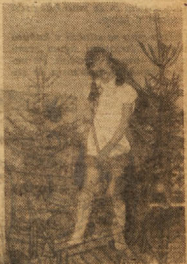
Prede je Rdeča kapica odšla k babici je pomagala mami pri njenem delu. (Tako se danes godi le še v pravljičah!)

Cprav so bili vsi člani kolektiva pravočasno obveščeni, do kdaj morajo prijaviti svoje otroke za obdaritev, so se nekateri spomnili svojih malčkov šele zadnji dan.