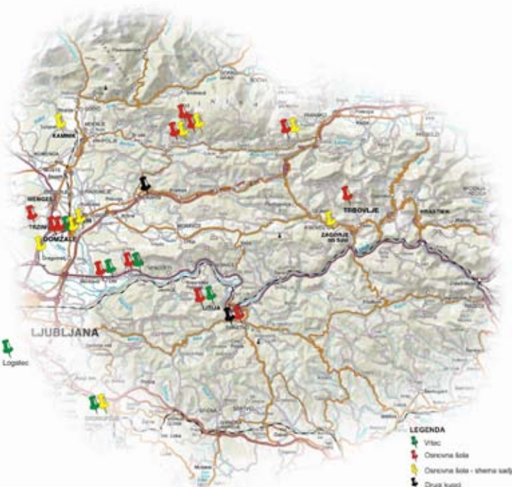
Prodajna mesta sistema lokalne samooskrbe na območju Srca Slovenije