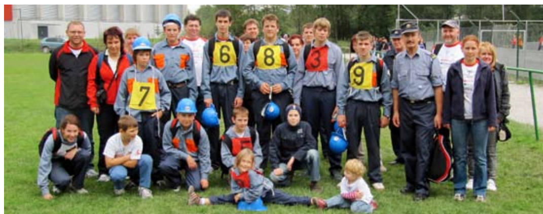
Enota mladincev PGD Topole s starši in mentorji

Tekst: Janez Koncilija, PGD Topole