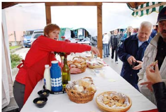
Domače dobrote na stojnici TD Mengeš