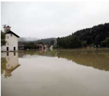
Poplava v Topolah