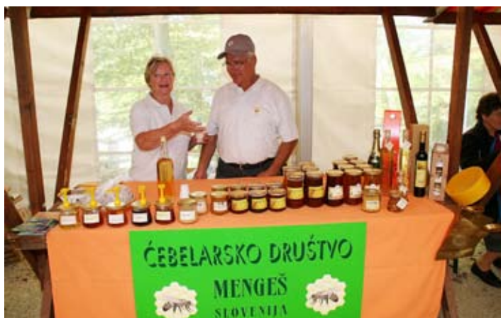
Stojnica Čebelarškega društva Mengeš

Organizatorji mednarodnega kongresa o apiterapiji in kakovosti čebeljih pridelkov so udeležencem v kratkem času poleg vsega želeli pokazati še delček utripa dežele. In če med, matični mleček, cvetni prah in propolis krepijo imunsko odpornost, je smeh in dobra družba še pika na i. Tokrat so organizatorji popeljali udeležence kongresa po Sloveniji, da spoznajo domovino gostiteljev.