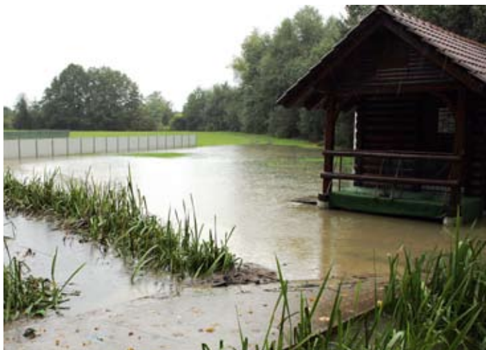
Poplavljenе skakalnice na Zalokah pod Gobavico

Čeprav je bilo pred skoraj mesecem dni vložena obilo truda v pripravo napovedane celodnevne prireditve v smučarskih skokih, se je narava kruto poigrala s člani kluba in starši tekmovalcev, ki so pričakovali lepe in dolge skoke na vseh treh skakalnicah. A prizorišče je bilo bolj podobno tekmovališču za kajakaše in kanuiste na divjih vodah. Običajno mirni potok Pšata se je ta dan spremenil v deroči hudournik. In tako so smučarski skoki dobesedno splavali po vodi.