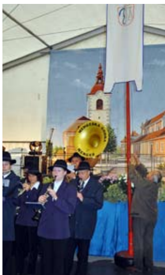
Dvig sejemske zastave

Tekst: Urban Ropotar