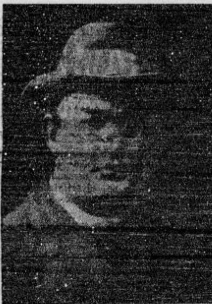
Dr. Janez Ev. Krek

Krek je s svojimi sodelavci naletel na hud odpor med mnogimi trgovci in gostilničarji, ki jih je hujskalo liberalno učiteljstvo. Oni niso hoteli razumeti, da gre boj proti oderuštvo in