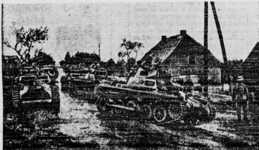
»Vse se oborožuje in neprestano govori o miru. Tudi Nemčija je imela zadnje dni orožne vaje, kjer so se posebno izkazali tanki.