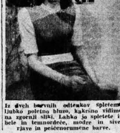
Iz dveh barvnih odtiskov spletno ljubko poletno bluzo, kakšno vidimo na zgornji sliki.

Leto naše leto bomo preživele brez čezmernega lepotečenja, torej kolikor mogoče naravno in sproščeno.