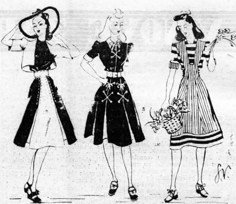
(Tri trije modeli so risani izrečno za »Družinski tednik« in niso bili še nikjer objavljeni.) Na naši sliki vidimo tri ljubke pomladanske obleke.

Joj!... zdaj se je pa otrok še zbedel!! To imaš od svojih vilic! Kakor da otrok ne zna z žlico jesti?! Za vilice je bilo še vse prezgodaj, to mati vendar čuti... na, zdaj bo pa še bljuvalal!!