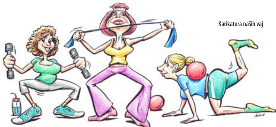
Karikatura naših vaj

itd.) za lepšo postavo in ohranjanje zdravja. Srečanja niso samo stroga vadba, ampak so namenjena tudi druženju. Še vedno velja stari grški izrek, da je zdrav duh v zdravem telesu, zato veselo na razgibavanje.