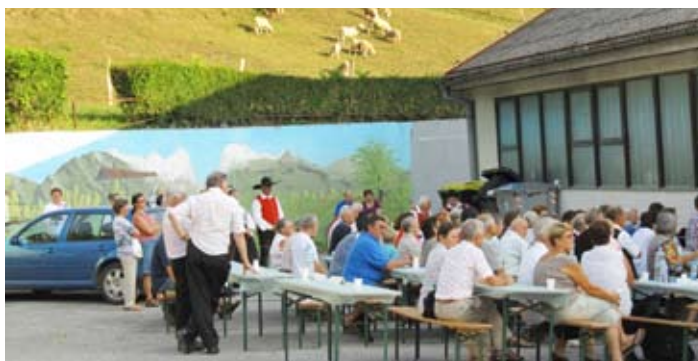
Obiskovalci so resnično uživali tako nad nastopi kot toplim soncem