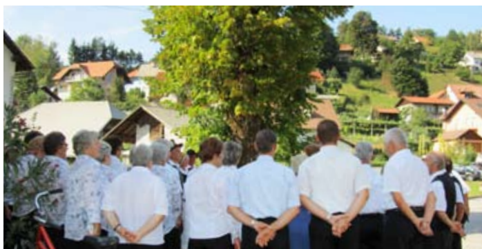
Pevci po lipo domačo (krašensko)

Zadovoljni prireditelji, nastopajoči ter še bolj zadovoljni poslušalci in gledalci, so obljubili, da se naslednje leto spet snidejo.