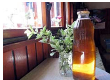
Kis z baziliko je čudovit na paradiznikovi solati

Pojdimo v kopalnico in z njim operimo in obrišimo ploščice, kadi in umivalnike. Če so madeži malo bolj trdovratni, dodajte malce tekočega čistila za kopalnice, ravno tako za straniščno školjko. Kis je nepogrešljiv pri pranju perila. Zmanj-