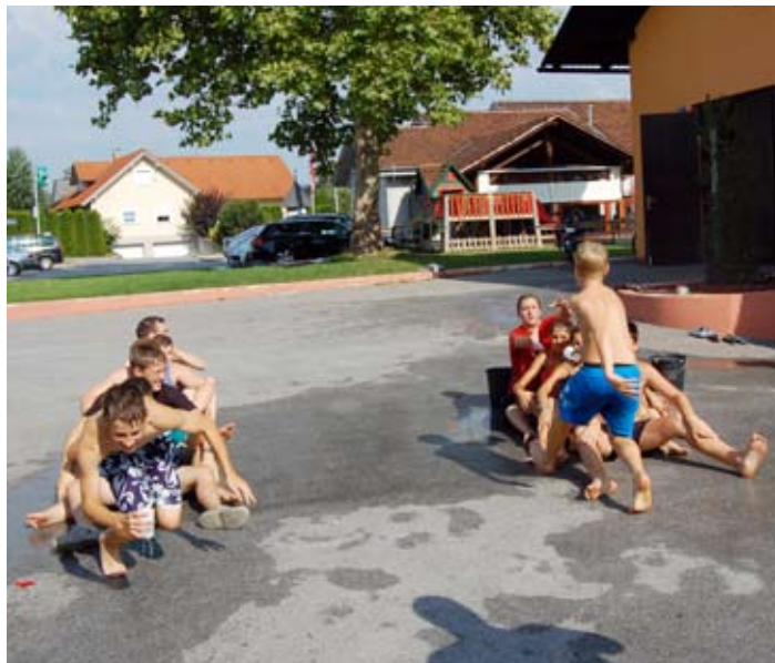
Polnjenje steklenice s preluknjanim lončkom

balončki. Tako smo na koncu res vsi čisto mokri imeli zasluženo malico – hot dog in sladico – kremno rezino. Po skupnem čiščenju dvorišča je sledila razglasitev rezultatov in zmagovalna ekipa se je odpravila za nagrado z našim poveljnikom in novim gasilskim avtom k Furman na sladole. Na pomoč k organizaciji in izvedbi nam je priskočilo tudi nekaj naših članov in članic, ki so na igrah mogoče še bolj uživali in si nagajali kot mladi. Tako smo sklenili, da drugo leto zadevo absolutno ponovimo z vodnimi igrami za vse naše člane.