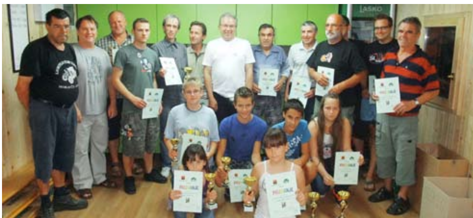
Zadovoljni udeleženci s pokali in priznanji