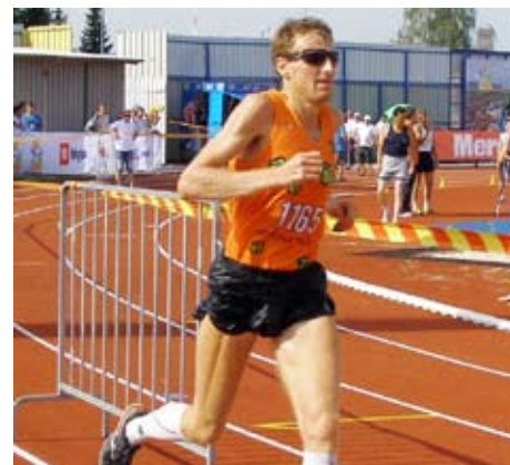
Robert v 21. kilometru domžalskega polmaratona