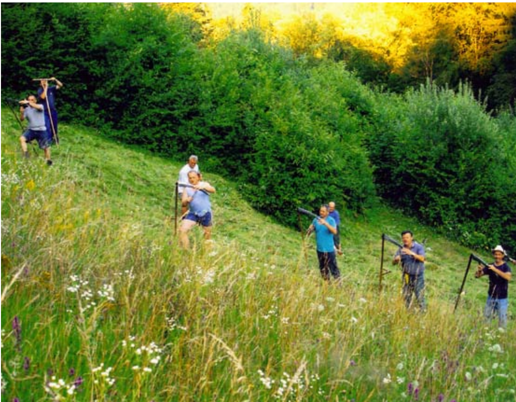
Kosci so nabrusili svoje kose.