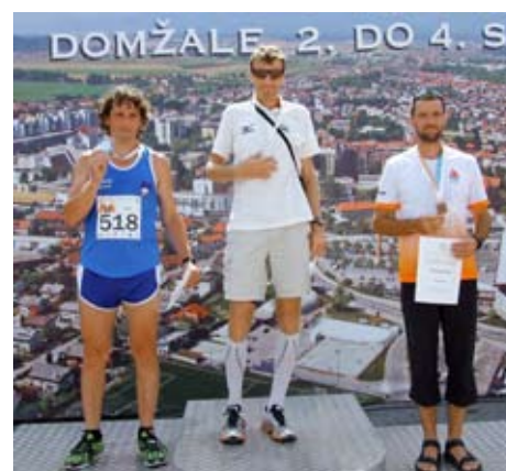
Najboljši trije na zmagovalnih stopničkah