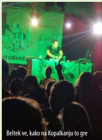
Beltek ve, kako na Kopalkanju to gre

Študentski klub Domžale želi vsem dijakom uspešen in smeha poln začetek novega šolskega leta, prav tako pa drži pesti za vse študente, ki jih še čakajo zadnji izpitni cukrčki.