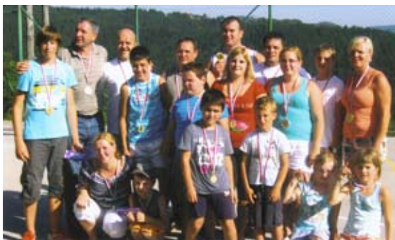
Dobitniki medalj v Zlatem Polju

Čeprav še sredi dopustov so se zbrali mladi in starejši ter se udeležili tradicionalnih družabnih iger. Okoli štirideset nastopajočih se je v petih različnih igrah po svojih močeh trudilo, da bi bili čimbolj uspešni. Tudi najmlajši so prikazali obilo svojih sposobnosti in spretnosti. Čeprav je sonce neusmiljeno pripekalo, je bilo prijetno, polno doživetij, ni pa manjkalo bodrenja navijačev na tribuni zlatopoljskega igrišča. Res pa je, da so vsi nastopajoči nestrpnost čakali razglasitve rezultatov in podelitev kolajn najboljšim. V šestih različnih starostnih skupinah so jih prejeli naslednji nastopajoči: