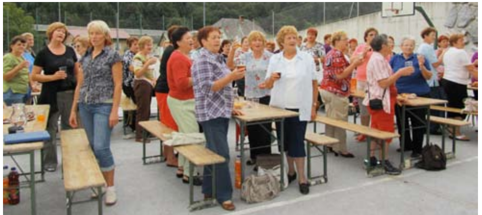
Veselo druženje v Blagovici

Kulturni program so krasile pesmi Ani Pungar-