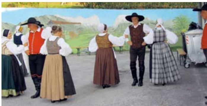
Folklorna skupina Cerklje je navdušila vse zbrane