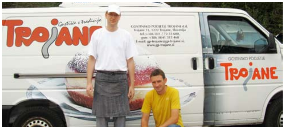
DPŽ Blagovica-Trojane se zahvaljuje Gostinskemu podjetju Trojane za odlično hrano in pogostitev na terenu