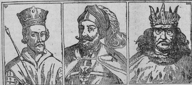
König Vladislav Jagello von Polen, Hochmeister Ulrich von Jungingen, Grössfürst Witold von Litauen. Zum 500. Jahrgedenktage der Schlacht bei Tannenberg

enberg v dotiko. Armada viteškega reda reda je bila vsled dolgega potovanja hudo utujena. Vkljub temu je krilo litavske armade popolnoma premagala. Ali nasledovali so sovravnike prehudo. Potem je glavna poljska armada, ki je bila poleg tega veliko številnejša, armado reda popolnoma premagala. Poleg zapovednika mojstra Ulrika je našo v tej bitki več kot 300 vodij nemškega viteškega reda svojo smrt. Mrliče so pokopali v leseni cerkvi v Tannenbergu, ki jo je še danes videti. Tam, kjer je veliki mojster Ulrik v boju proti divjakom svojo smrt našel, postavili so kapelico, ki se je pa pozneje podrla. Danes se vidi od te starodavne kapelice le še kamnenje fundamentov. Od prostora, kjer je stala kapelica, vidi se prav lepo celo pokrajino nekdanjega bojišča. Leta 1901 so postavili na tem kraju velikanski kamenspomnik... Na naših slikah vidimo najprve ta kame-