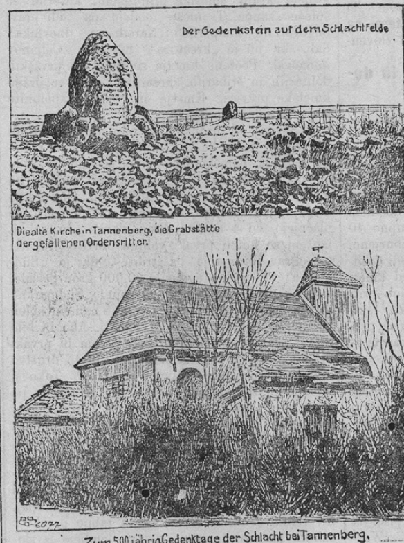
Zum 500-jährigen Gedenktage der Schlacht bei Tannenberg.