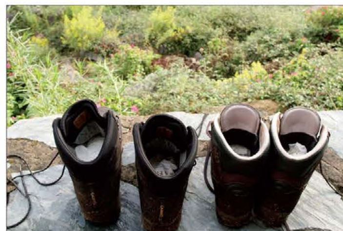
S časopisnim papirjem "zabasani" pohodniški čevlji po zaključku "dežavne" etape