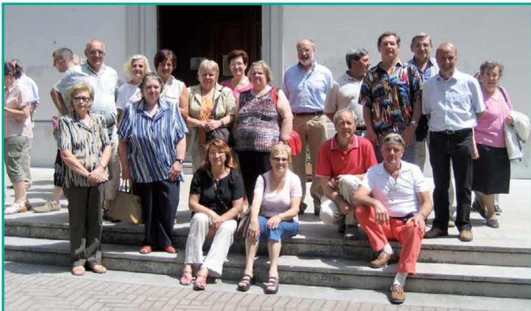
Vrstniki letnika 1946 iz Števerjana so v soboto, 17. junija, skupaj proslavili svoj okrogli življenjski jubilej. V prijetnem razpoloženju in sončnem vremenu so šli na izlet po Gradeški laguni. Ustavili so se tudi v Marijinem svetišču na Barbani, kjer so se med sveto mašo zahvalili za vse prejete darove.