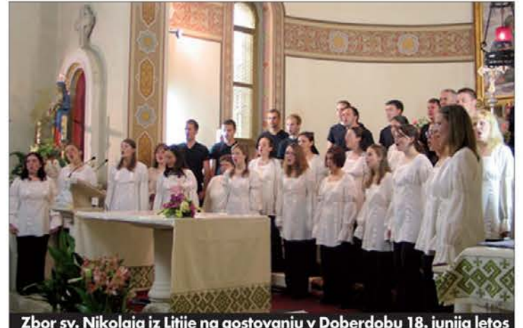
Zbor sv. Nikolaja iz Litije na gostovanju v Doberdolu 18. junija letos

zaslužen prvi madžarski Cantemus mixed choir. Isti je osvojil tri prva mesta za izvedbo sodobnih skladb obveznega programa. Odlični Zbor sv. Nikolaja iz Litije se je uvrstil na tretje mesto v kategoriji monografskega programa. Škoda, da ni izkoristil priložnosti in da ni namesto štirih črnih duhov-