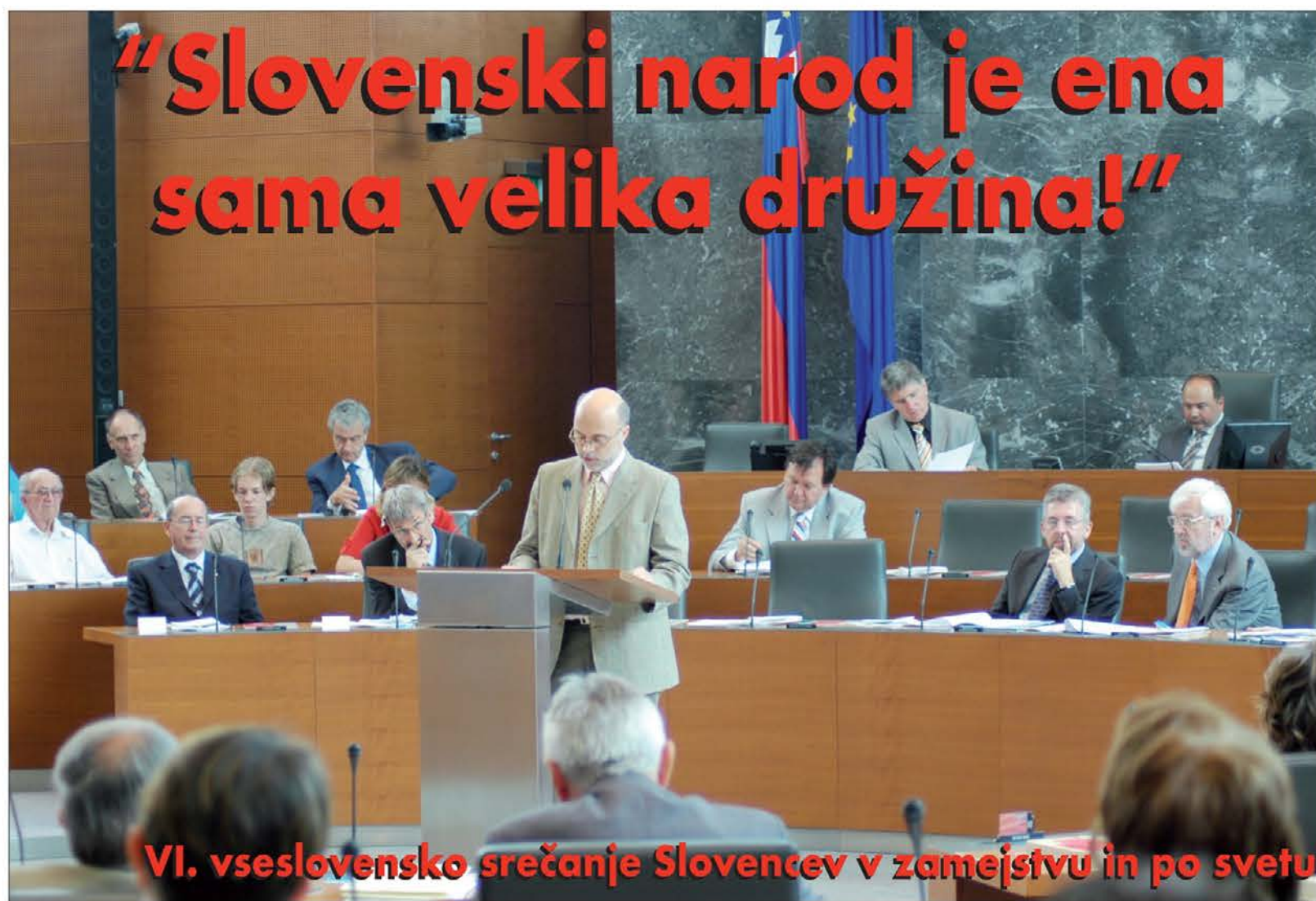
VI. vseslovensko srečanje Slovencev v zamejstvu in po svetu

In če se bomo vsi skupaj počasi približali še uredničenju naši večnih sanj o spravi, se bo uresničila tudi pesnikova želja, da bi med nami utihnila razprtije. Šele takrat bosta upravičena zdrav ponos in vnema za "čast dežele".