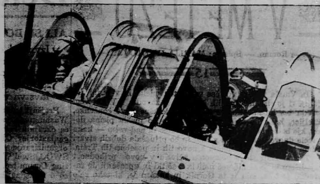
V ameriških vojaških aeroplanih je vpeljan popoln telefonski sistem, po katerem se morejo letalci tekom poleta pogovarjati s poveljniškim uradom na letališču.