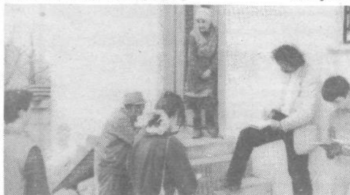
Raziskovalci pri Koštovcu na Osovniku