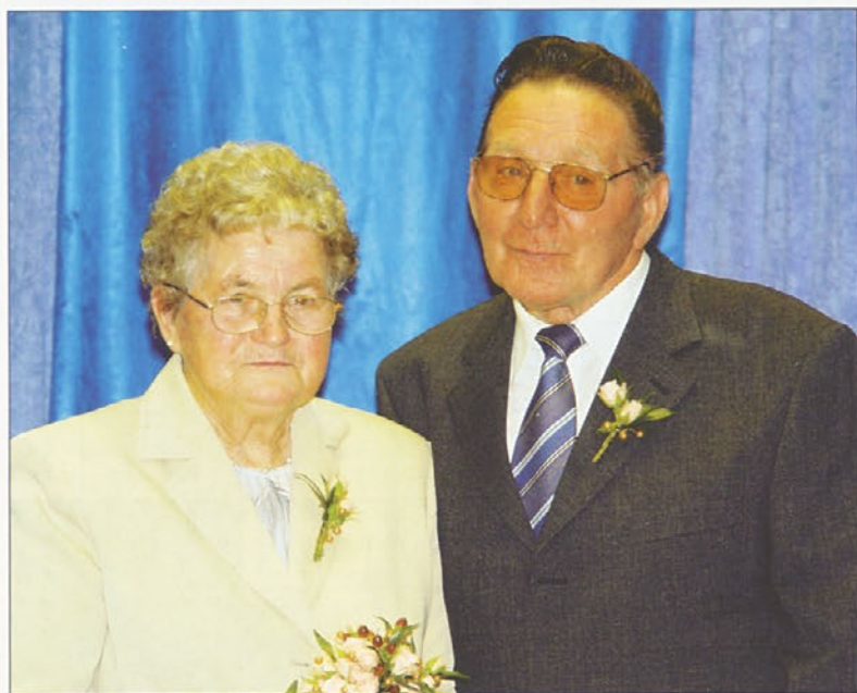
Zgoraj: zlatoporočenca Pislak Desno: zlatoporočenca Topolovec