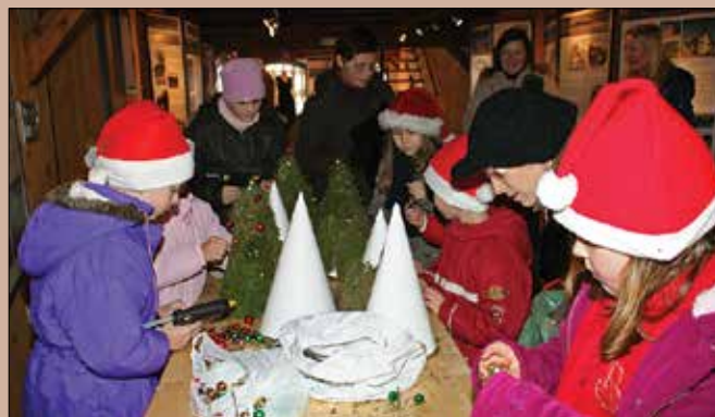
Tokratno dogajanje v toplarju je bilo v znamenju praznikov ob koncu leta.

Učenke nazarske osnovne šole so z mentorico Hofbauerjevo ob spremljavi harmonikarja pripravile glasbene in plesne točke na temo zime in prihajajočih praznikov. S svojim prikupnim nastopom so mladi ogreli srca prisotnih. Da so se ogrela še telesa, so poskrbeli člani turističnega društva na svoji stojnici, kjer je zadišalo po cimetu