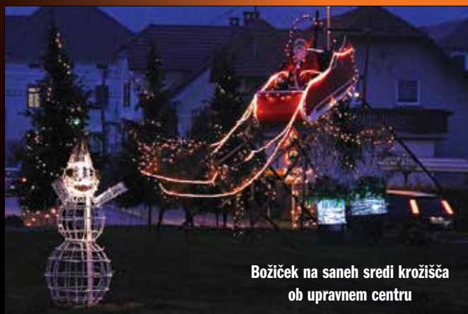
Božiček na saneh sredi krožišča ob upravnem centru