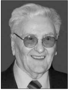
Piše: Aleksander Videčnik