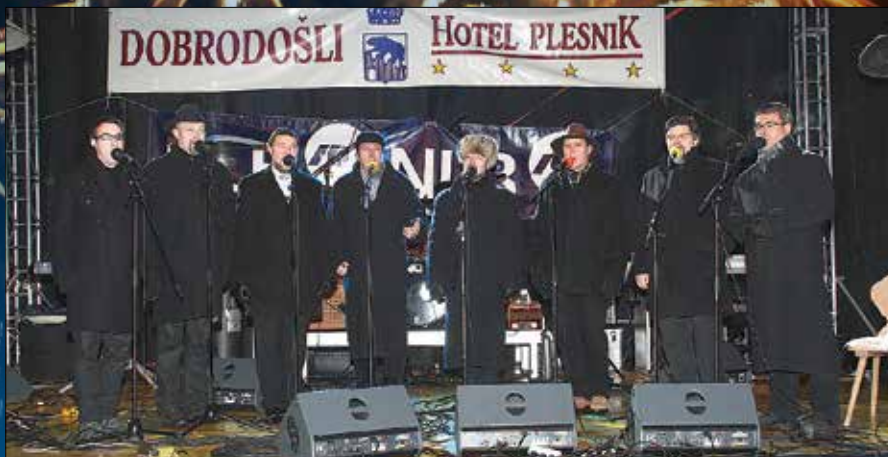
Slovenski oktet je tudi tokrat pripravil izjemen koncert svojih najlepših pesmi.