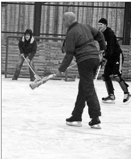
Novoletni hokejski derbi med domačini in gosti iz Ljubljane je bil prava poslastica za gledalce.

Novoletno dogajanje se v Solčavi vsako leto seli na drugo lokacijo. Center Rinka že nekaj let redno skrbi, da domačini pokurijo kalorije s silvestrske noči, pa naj bo to z večernim pohodom z baklami ali z igranjem hokeja kot letos. Hit leta