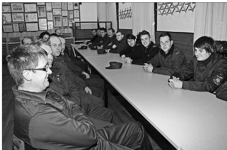
Na izobraževanje se je prijavilo 52 slušateljev iz devetih društev.

gasilskih društev namenjajo tej humanitarni dejavnosti. Čestital je vsem, še posebej pa članicam za opravljeno izobraževanje.