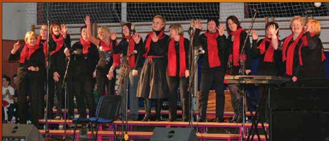
Za presenečenje večera so poskrbele učiteljice, ki so sestavile priložnostni zborček.

restavracija - sobe (Arja vas - Velenje) tel.: 03 714 80 60 Marjola - malice (Žalec - center) tel.: 03 710 37 30