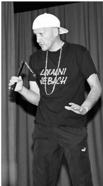
Avdicija 2 v izvedbi KD Tuhinj je prijetno zabavala.