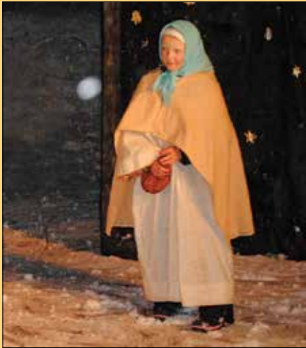
Zvezdica Zaspanka si želi nazaj med zvezde.