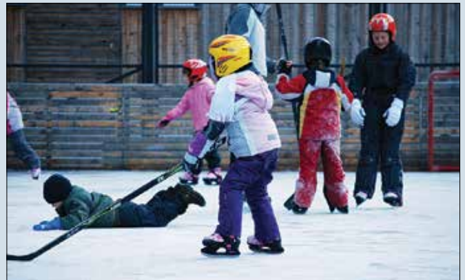
Tečaj drsanja za otroke je bil prava počitniška poslastica.