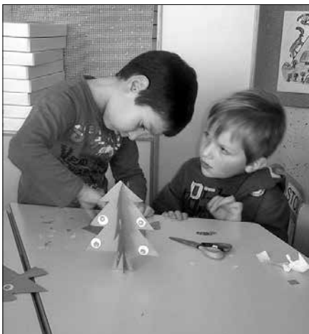
Učenci 1. razreda so iz kartona izdelali prostostoječe novoletne smrečice.

Praznični december smo na osnovni šoli Rečica ob Savinji zaključili z ustvarjalnimi delavnici, na katere smo povabili otroke iz vrta. Učenci 1. razreda so iz kartona izdelali prostostoječe novoletne smrečice in jih okrasili z okraski iz papirja.