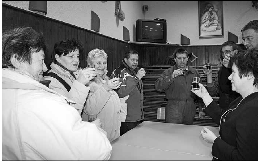
Topličanke in radmirski gasilci so nazdravili na plodno sodelovanje.