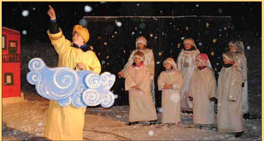
Sneženje je pravljičico na ledu naredilo še bolj zimsko in privlačno.