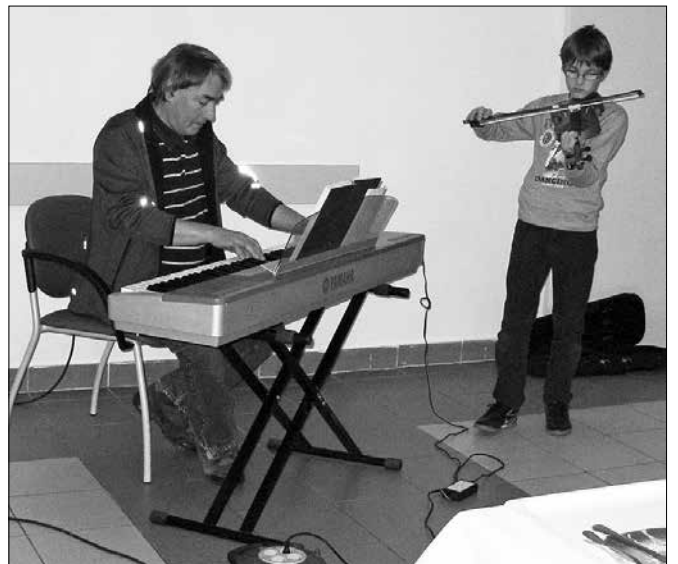
Glasbena gosta sta s klaviaturami in violino stanovalcem zbudila v vsakem od njih najlepše spomine.

jala: »Topel pozdrav vam namenjam v tem predprazničnem večeru, spoštovani gostje in obiskovalci. Z vsakim trenutkom se bolj zavedamo moči skrivnosti, ki prihaja v teh dneh med nas. Obdarja nas s tisočeriimi toplimi mislimi, občutji, željami ... Z vsem, kar nas združuje, povezuje, kar daleč presega tisto, čemur radi rečemo »no-