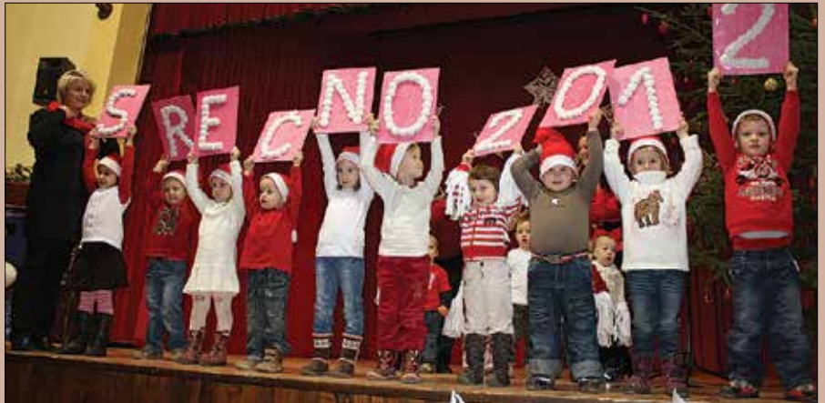
Posebno voščilo otrok iz bočkega vrtca

Otroci iz vrtca, osnovnošolci, pevci in pevke ženskega in moškega pevskega zbora domačega kulturnega društva, cerkveni pevski zbor, Lamprečka dekleta in Ljudske pevke Lipa iz Šmartnega ob Dreti so pripravili prijetno urico sprostitve ob narodnih in ponarodelih pesmih, pesmih domačih in tujih avtorjev. Mnoge so razveselili plesni ritmi. Najbolj prisrčni so bili najmlajši, ki so z odra sporočali: »Srečo, veselje, miru in ljubezni si vsak otrok želi ...«