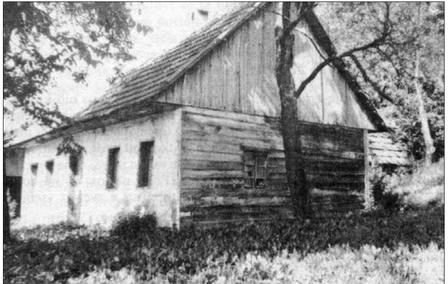
Kočica pri Vrtačkem Jaku v Nazarjah, fotografirana leta 1980. To je bila ena redkih še stoječih tovrstnih stavb, ki so bile zunaj lesene in znotraj tudi, vmes so »šopali škopnat mort«. To je bila zmes ilovice, apna in drobno zrezane slame.

»Bila sem ofrska,« je pripovedovala vprašana. »Takrat je bila oferija kočica z malo vrta. Koče so bile največkrat lesene, vedno pa s črno kuhinjo. Naša je imela lopo, kuhinjo in sobo. V teh prosto-