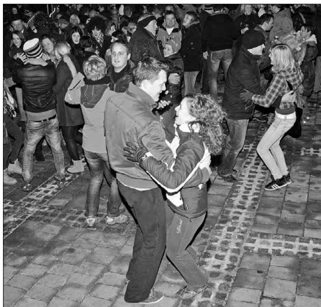
Veselje ob prehodu v novo leto na mozirskem trgu