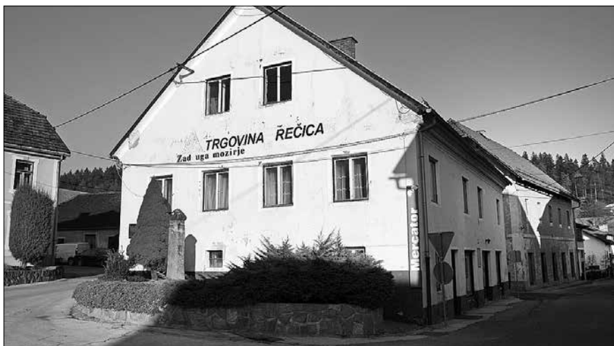
Občina bo od ZKZ Mozirje odkupila objekt nekdanje trgovine in poslovnih prostorov na Rečici ob Savinji.