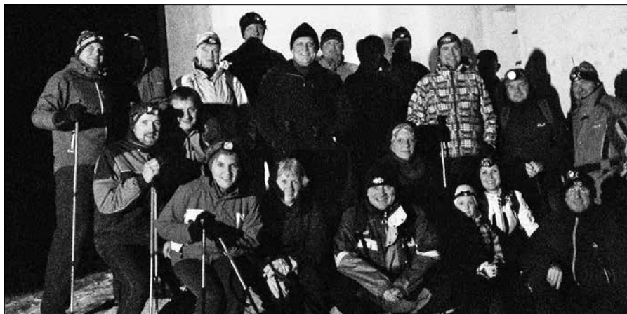
Skupina pohodnikov se je pred božičem že devetih podala na Semprimož.