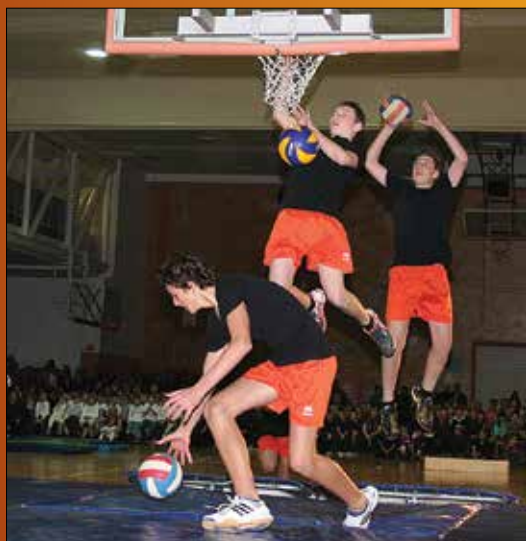
Posebno atraktivna točka je bila zabijanje na koš.

Ob vstopu na prizorišče je bilo najprej moč opaziti umetelno priložnostno sceno. Umeten sneg iz stiropornih krogel in drobne luči od vsepovsod so napovedale pravljíčnost in čarobnost dogodka. Tudi prva točka, ko so šolarji odplesali svoj nastop ob pritaženih lučeh, je to napovedovala. Vsak razred je pripravil svojo pevsko, plesno ali kako drugače obarvano točko. Poleg tega so se izpostavili mnogi posamezniki. Tisti bolj izkušeni, ki so nastopali že na drugih odrih, kakor tisti, ki so se tokrat pred občinstvo podali prvi, prav vsi pa z veliko mero samozavesti, poguma in že-