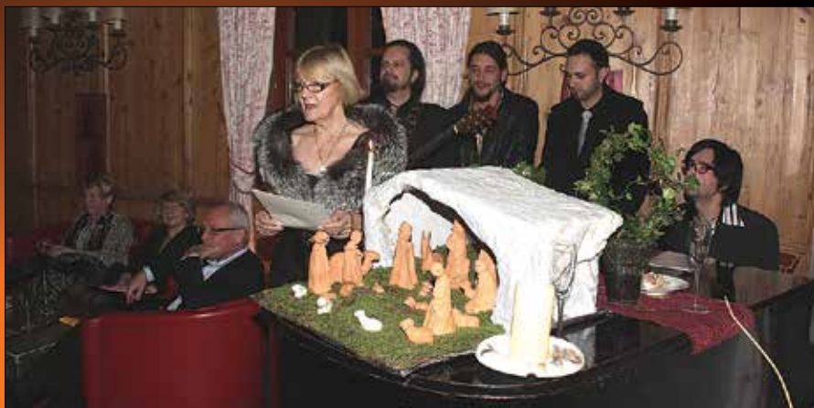
Sprejem novoletnih gostov v hotelu Plesnik je popestril Zodiac band.