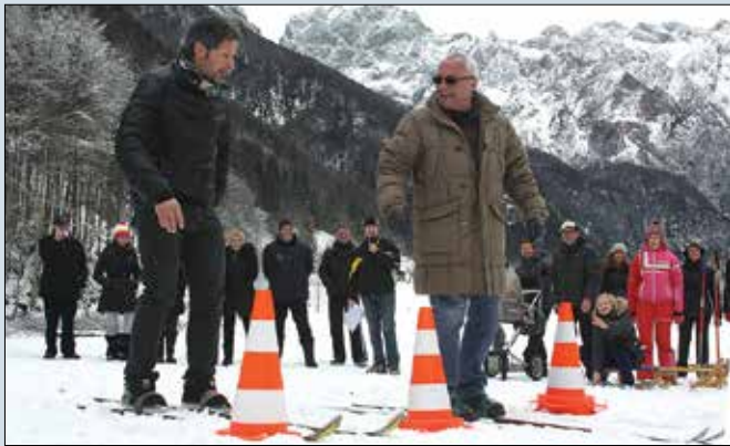
Obujanje spominov na otroštvo in prve smuči ali pa prvič na lesenih dilcah