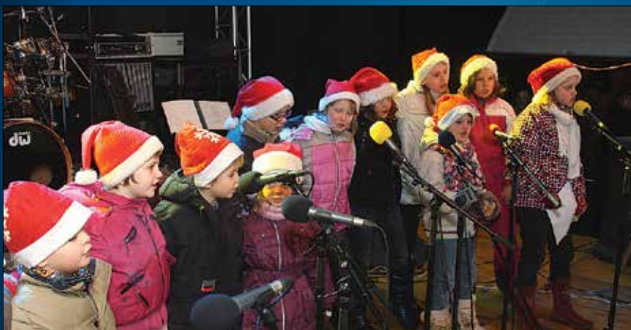
Solčavski božični palčki iz POŠ in vrtca Solčava so tudi tokrat navdušili.