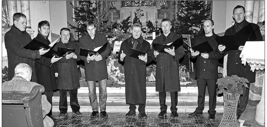
Člani okteta Žetev so zapeli nekaj božični pesmi tudi v angleškem jeziku.