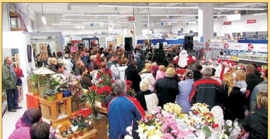
Božiček je otrokom povedal zanimivo zgodbo o zajčku in njegovem kožuščku, nakar jim je razdelil ptičje hišice, bonbone in pomaranče.