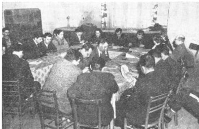
ZASEDANJE ZADRUŽNEGA SVETA KZ LENART — Člani združnega sveta Lenarške kmetijske zadruge so na zadnji seji razpravljali o gospodarjenju v preteklem letu. Na sliki: med poslušanjem poročevalca o izvršitvi sklepov zadnje seje ZS.

din. Zadruga gotovo poslovnega leta ne bi zaključila s tako izgubo, če bi bila lani tudi boljše sadna letina, saj je bil odkup sadja zelo slab. V lenarški zadrugi menijo, da pšenica ni primerna za Slovenske gorice, zato bi je ne kazalo več forsirati, kot se je to svojčas delalo. Težiti bi bilo potrebno bolj smelo k razvijanju osnovnih panog živinoreje in sadjarstva. Zadrugi svet kmetijske zadruge Lenart je pred kratkim odobril nakup večjega števila strojev, kamionov in traktorjev. Skupna vrednost nabavljenih osnovnih sredstev bo 50 milijonov din. Člani za-