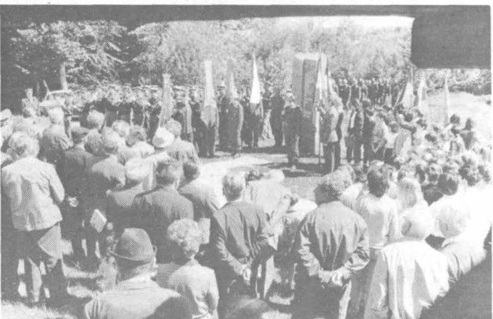
8. maja ob 11. uri. Trenutek zgodovine, doživet spomin na Orlah v spomin na zadnje boje za osvoboditev naše Ljubljane.

Iz slavnostnega govora predsednika Predsedstva SRS