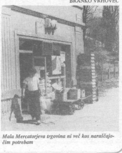
Mala Mercatorjeva trgovina ni več kos naraščajočim potrebam