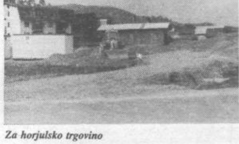
Za horjulsko trgovino

Z gradnjo tega tako potrebnega objekta naj bi predvidoma začeli na začetku naslednje polovice letošnjega leta, dograjen pa naj bi bil še pred novim letom. Vse skupaj zdaj že nekoliko zamuja, saj so imeli precej težav s pridobitvijo zemljišča, ni pa bilo na voljo tudi dovolj potrebnih finančnih sredstev.