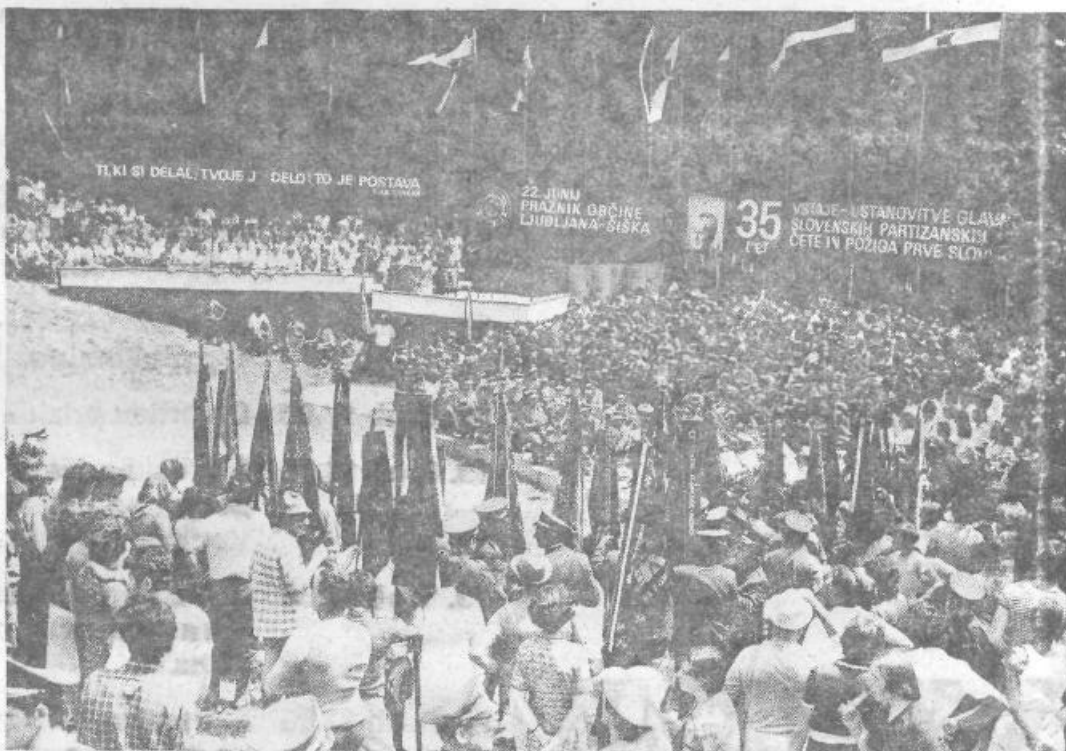
... leta 1976, KS Gameljne-Rašica, na Rašici