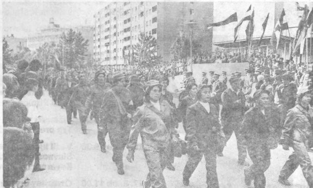
... leta 1975, povorka delovnih ljudi in občanov