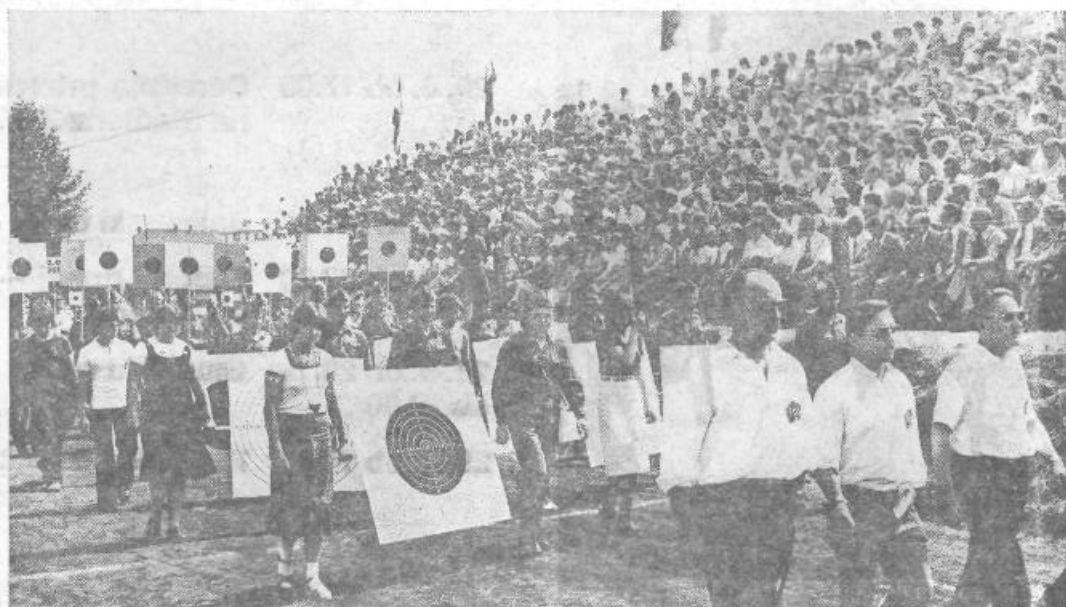
... leta 1977, KS Zgornja Siška, stadion Ilirije