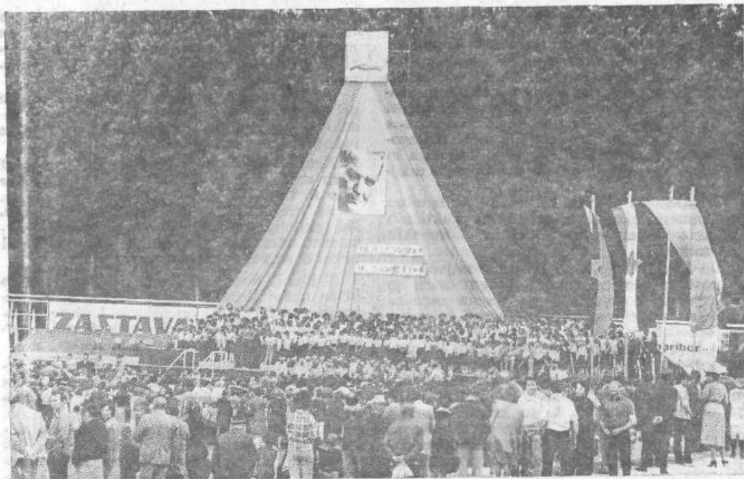
... leta 1978, KS Medvode, osrednji stadion Medvode

SKUPŠČINA OBČINE IN DRUŽBENOPOLITIČNE ORGANIZACIJE LJUBLJANA-ŠIŠKA