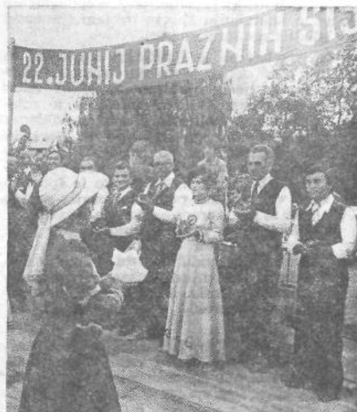
Ob tabornem ognju v Kosezah — tradicionalna prireditve