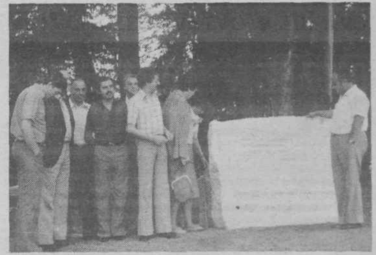
Gradnja vodovoda je bila trda, kot je bil trd kamen, iz katerega je pritekla voda