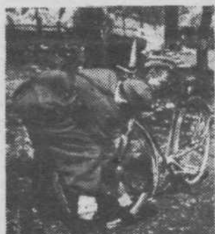
Partizanski kurir-kolesar