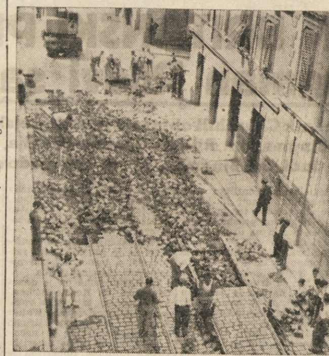
Včeraj zjutraj so se končno s precejšnjo zakasnitvijo začela dela za obnovo cestišča Istrske ulice. Z deli so začeli na odseku od Ul. P. Veronesi do Ul. Industria, zaradi česar so zapeli krampi na Istrski cesti.