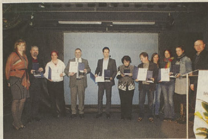
Prejemniki priznanj za najbolj inovativne projekte v lokalnih skupnostih.

Konferenca je bila izvedena v okviru evropskega projekta IN-EUR na programu INTERREG IVC, pri katerem kot partner sodeluje Razvojni center Srca Slovenije.