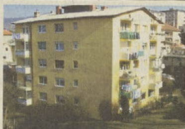
Eden prvih blokov v Zasavju, kjer so se lastniki odločili toplotno izolirati fasado