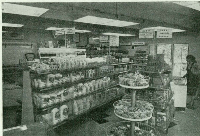
Takšna sta lokala »LINDEK« in »TOPLICE«

zlasti pa realizacijo te ideje pozdraviti s toliko večjim odobravanjem, ker je ravno v letošnjem letu mednarodnega turizma vsak podvig v smeri modernizacije, izboljšav in polepšanja trgovin dobrodošel in zaželen.