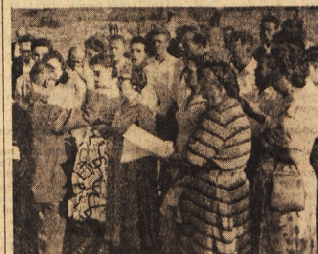
Na spominski svečanosti v Bazovici so nastopili tudi štirje pevski zbori. Na sliki lonjerski zbor poje »Zrtvam«.

Nagrada italijanskega državnega združenja filmskega tiska so dodelili američkemu filmu »Attacks«, ki ga je režiral ameriški režiser Robert Aldrich.