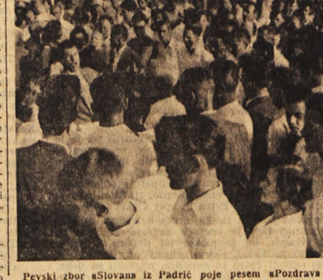
Pevski zbor »Slovans« iz Padric poje pesem »Pozdrava«.