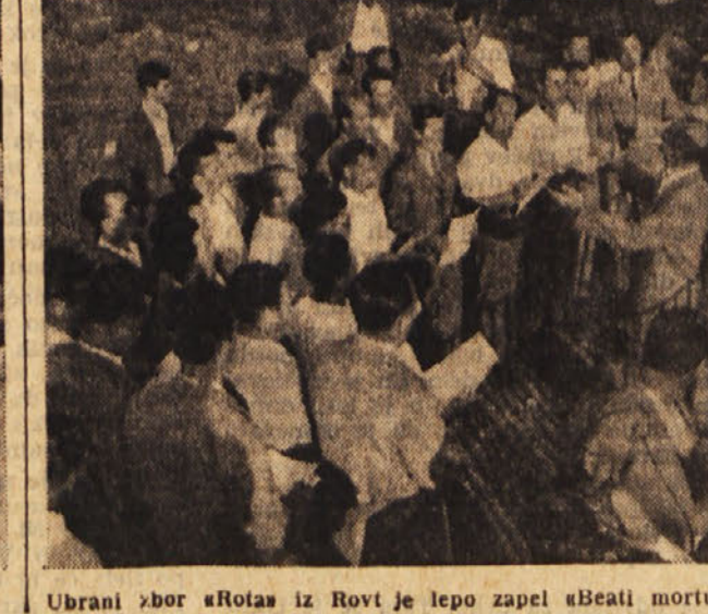
Ubrani zbor »Rotas« iz Rovt je lepo zapel »Beati mortuis«.