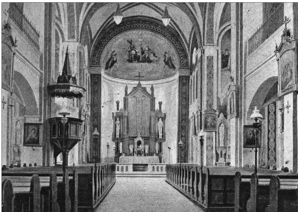
Notranjost cerkve sv. Štefana v Ribnici okoli leta 1880 (Zbirka razglednic Muzeja Ribnica, inv. št. 629a).

V 60. letih prejšnjega stoletja so sezidali današnje župnišče in tako so morali spet vse prenesti v novo stavbo. Gradivo so zložili v omare, popisa arhiva niso sestavili. Tudi takrat se je lahko kaj izgubilo oziroma založilo.