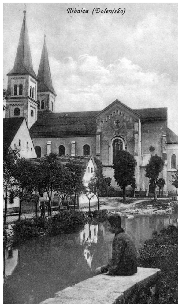
Cerkev sv. Štefana v Ribnici pred letom 1900 (Zbirka razglednic Muzeja Ribnica, inv. št. 675n).

11. 6. 1899 Sv. oče Leon XIII. so izdali okrožnico, s katero se opominja vse človeštvo, naj bi se letos posvetilo presvetemu Srcu Jezusovemu. Zato se je v petek 9. 6., t. j. na praznik presv. Srca Jezusovega v soboto in nedeljo obhajala slovesna tridnevnica; vsak dan po sv. maši so se molile novo potrjene litanije presv. Srca Jezusovega, v nedeljo se je vsa fara posvetila presv. Srcu Jezusovemu z novo posvetilno molitvijo. Nato se je zapel Te Deum .