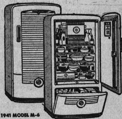
1941 MODEL M-6