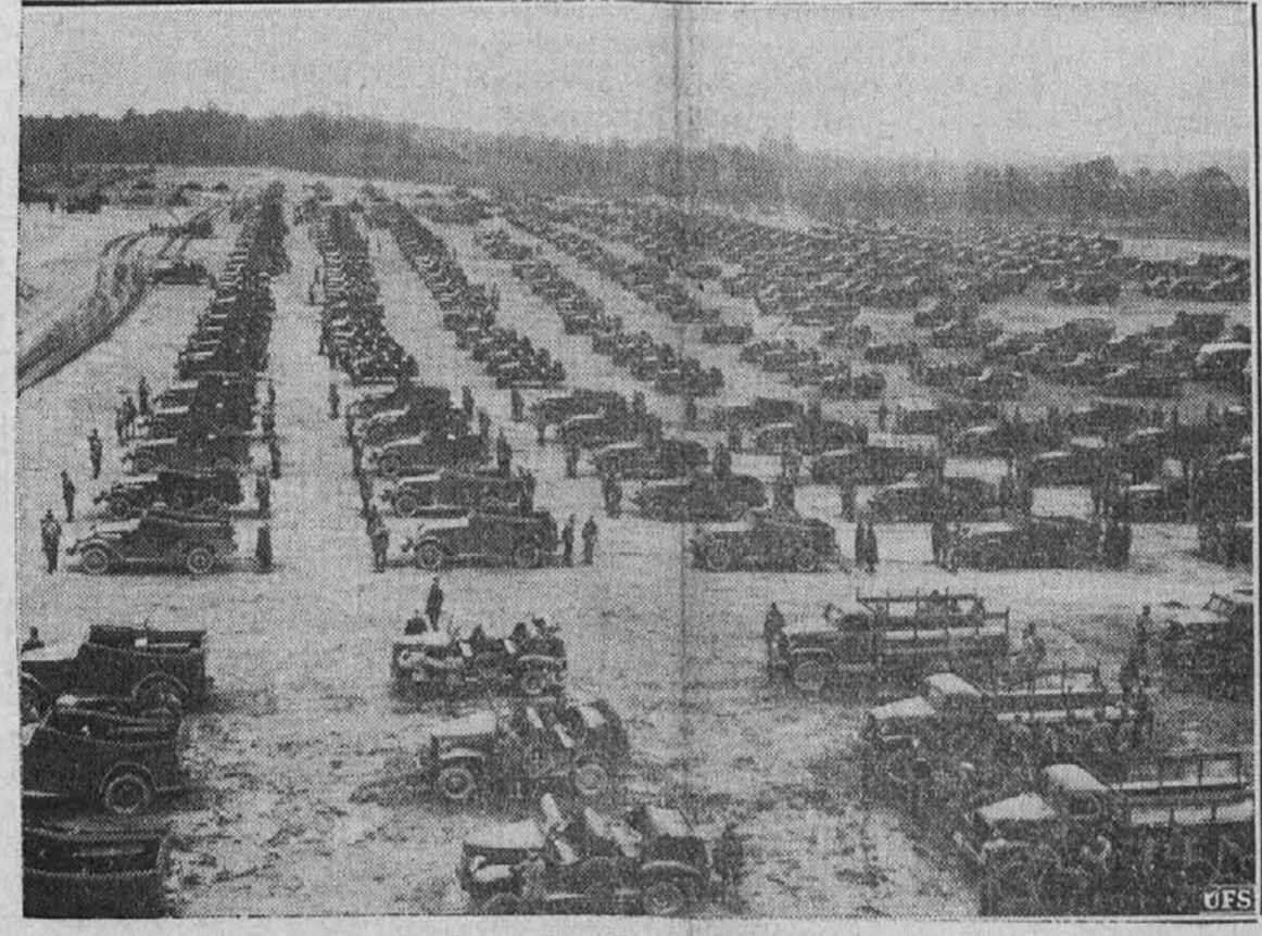
Da ne bo kdo tam preko Atlantika mislil, da smo v Ameriki kar tako, naj si malo ogleda malo drobnico naše vojaške moči. To je del 2. ameriške oklopne divizije, ki se nahaja v Fort Benning, Ga. Več kot 2,000 oklopnih edinic šteje samo ta divizija.