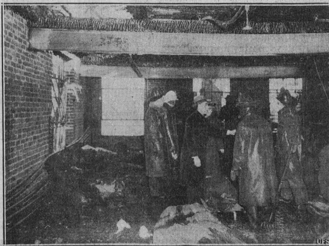
Ogenj se je z vso naglico razširil v poslojju New Haven Quilt & Pad Co. v New Haven, Conn., kjer je bilo v tretjem nadstropju zajetih v plamenih 10 mož, ki so bili zaposleni pri kompaniji in so popolnoma žgoreli. Kompanija je bila zelo zaposlena, ker ima za $2,000,000 dolarjev odej naročila za ameriški armada.

Po zmerni ceni L. R. MILLER FUEL CO. 1007 E. 61. St. ENDicott 1032