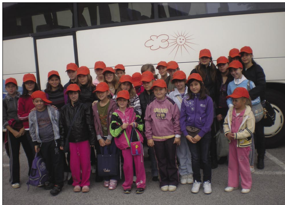
Učenci števanovske šole na trgatvi v Dobrovniku