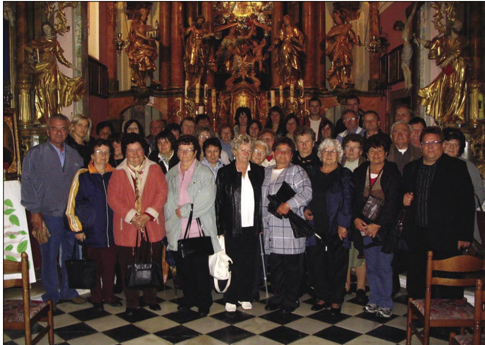
Sakalovski romarji v cerkvi na Sladki gori

Na koncu naše poti smo se še ustavili v Murski Soboti v Intersparu, vsak je kupil kaj za domače, potem smo se srečno vrnili domov. Čeprav je cel dan deževalo, nas to ni prav nič motilo, imeli smo se lepo in vzdušje na avtobusu je bilo zelo veselo, posebej v zadnjem delu avtobusa.