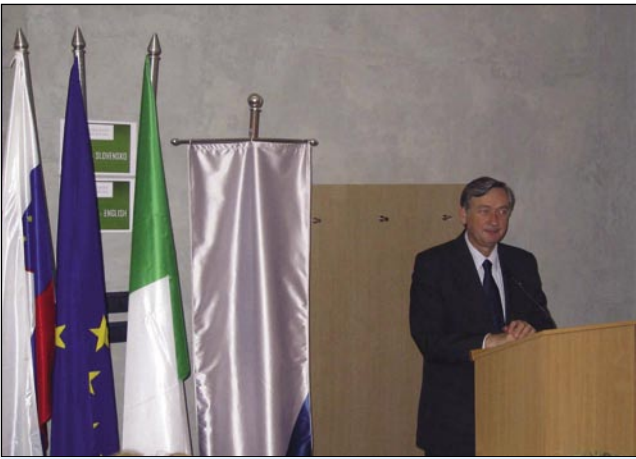
Častni pokrovitelj konference, predsednik RS dr. Danilo Türk

spoštovanju drugih jezikov in kultur. Idealen laboratorij za raziskovanje takega sobivanja in učenje o njem predstavljajo območja, kjer večinski narodi živijo skupaj s pripadniki ene ali več manjšin in kjer vsakodnevno prihaja do kulturnih, etničnih in jezikovnih stikov ter prepletanj in vplivov. Slovenija ima s tem bogate izkušnje, saj na njenem teritoriju živijo avtohtone in druge manjšine, prav tako pa so Slovenci manjšina v sosednjih državah kot tudi drugod po svetu. S tem v zvezi se postavljajo različna zanimiva vprašanja, na primer o položaju (pravnem, jezikovnem) manjšin v Sloveniji kot tudi pripadnikov slovenske manjšine v sosednjih državah in po svetu. Vprašanja jezikovnega položaja in izobraževanja manjšinskih skupnosti je želela osvetliti mednarodna dvodnevna znanstvena konferenca z zgornjim naslovom, sredi septembra na Fakulteti za humanistične študije (FHŠ) v Kopru . Soorganizatorji konference pa so med drugim bili še Inštitut za narod-