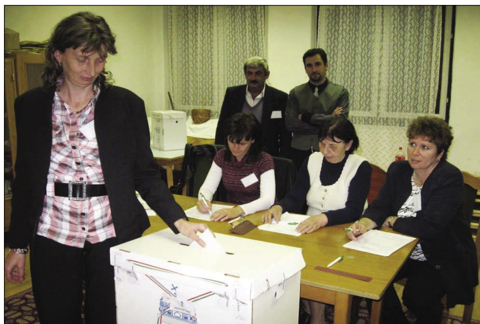
Volitve v Števanovci

Po cejlom rosagi je kauli 47 procentov volivcov šlau volit, tau je menja, kak ji je šlau pred štirimi (53 %) pa pred osmimi (51%) lejtami. Dapa tau je tó nej bilau vsepovsedik gnako, največ lidi je šlau volit na vzhodnom tali države, najmenje pa v žüpaniji Pešt. Kakoli so čedni politični analitiki pravli, ka pri tej volitvaj so nej telko pomembne stranke (pártok), so se zatok strankarske preference pokazale pri varašaj pa žüpanijski skupščinaj (megyei közigyhés) tó. Mirne düše leko povejmo, ka je volitve daubo FIDESZ, v vsej devetnajset žüpanijski skupščinaj de emo največ lidi. Tau valá za budimpeštansko skupščino tó. Do spremembe je prišlo pri prvom človeki Budimpešto