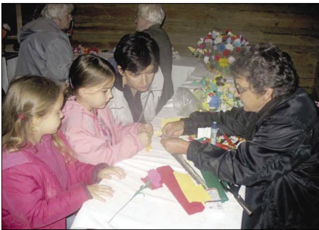
Gospa Iluš Dončec včijo mlajše rauže rediti

Na vsej narodnostni dnevaj v največšom varaši Železne županije je problem biu, ka so mlajši nej meli kaj za delati. Letos je tau ovak bilau, čaka-