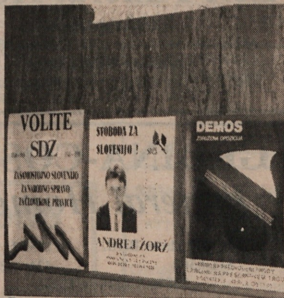
Demos posters were displayed at the Slovenian Home on Holmes Ave. during the "Council" open meeting on Monday. The posters were used by the Demos group in Slovenia and paid for from contributions collected by the Slovenian-American Council.

Asked to explain his popularity, even as Communists were on the run in Slovenia and across Eastern Europe, Kucan said: "If I win (the presidency) it will be an expression of gratitude for a peaceful transition to democracy."