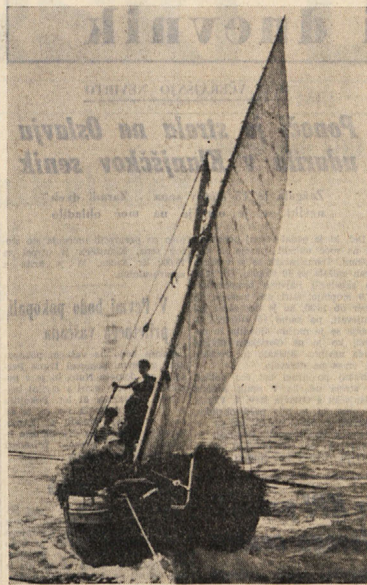
Zares ni potrebno biti lastnik jahte, da bi se človek mogel podati na zanimivo, prijetno in zdravo potovanje vzdolj prekrasnih obal Jadrana. Kdo ve kam sta se prispela oba ljubitelja morja na sliki? Naj bo to kjerkoli, želimo jima mnogo vedrega vremena, ugodnega vetra in mornarske sreče.