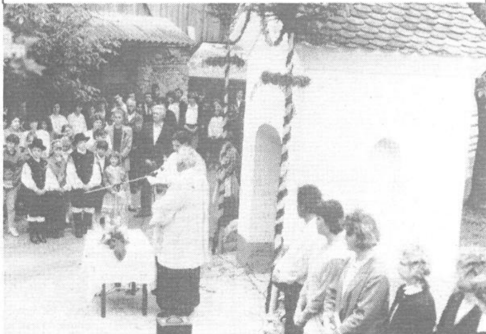
Slovesnost pred starejšo kapelico