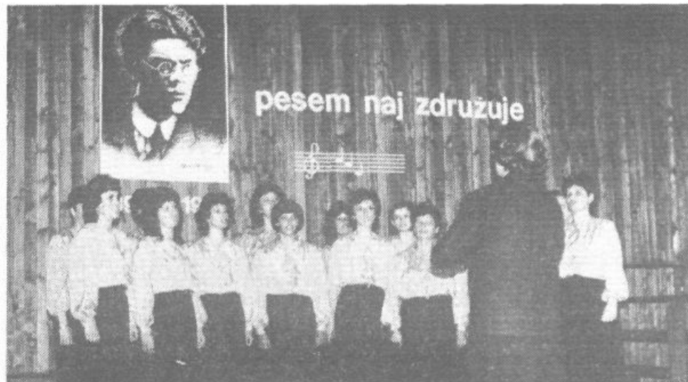
Ženski pevski zbor KUD »Marij Kogoj« s Turjaka