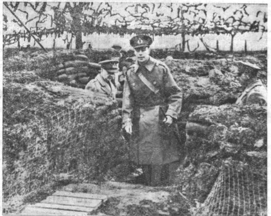
Levo: S takimi topovi je zavarovan v Ameriki Panamski prekop — Desno: Angleški kralj je obiskal Maginotovo črto

ko delo, ki je bilo započeto, tudi izvršeno za srečnejšo našo skupno bodočnost. Mir božji! Hristos se rodi! — V Zagrebu, na pravoslavni božič. — Dr. Vladko Maček.