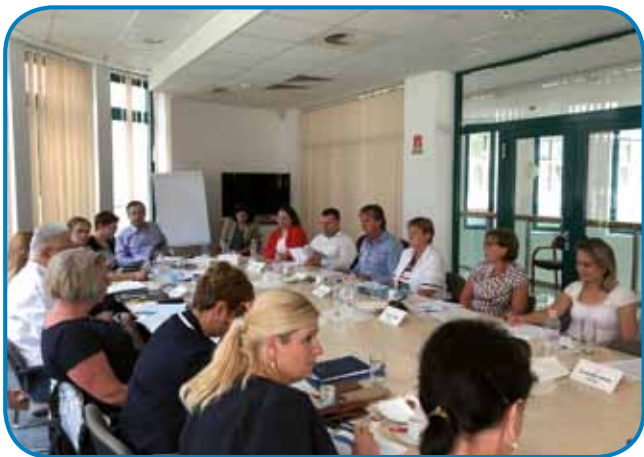
Usklajevalnega sestanka v Budimpešti so se udeležili predstavniki obeh narodnostnih skupnosti ter predstavniki ustreznih resorjev