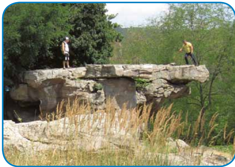
Zaman eden sam sprobava, kamen v Szentbékállli se samo od več lödi vuja

V grauboj vročini smo si napunili plastične glaže (eške za na paut tö), si pogasili žöu pa se že dročkali dale po lagvi vogrski poštijaj. Čeden telefon