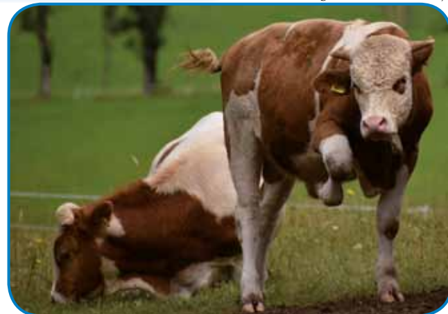
V dolini se na travnikaj pase tudi dosta krav

Po tistom, ka smo se spočinaule, smo šle poglednot malo naokauli. Mimo kokauši pa dve lepah kokautov smo prišle do zidine, v steroj je inda svejta bila štala za maro, zdaj pa se v njoj muvjajo tisti turisti, steri se pripelajo z autodomi, pa ške tisti, steri spijo v šatoraj na bližnjom travniki. Šle smo ške malo najprej, v breg, pa nej preveč visiko, vej pa morem priznati, ka najrajši velke brege gledam od daleč. Pogled na Veliko Babo, Koroško in Kranjska rinko, Skuto, Dolgi hrbet, Grintovec in Kočno je biu tiste tri dni, stere smo preživele na Jezerskom, furt malo ovakši. Najbole zanimivo je bilou te, gda so se gor in dol po bregi zdigavale in spüščale meglíce. Kak ena mala bela pika se je na bregi vidla streja Češke kočé, stera stogi pod severnim talom Grintovca. Postavljena je na nadmorski višini 1543 metrov. Češka kočé se té ram, namenjeni planincom, ne zové samo tak, liki zavolo toga, ka so jo Čehi rejsan tudi gor postavili. Uradna otvoritev je bila 26. julijuša 1900. Zanimivo je, ka so Čehi, steri so v té kraje odili kak turisti in planinci, v Pragi konec 19. stoletja