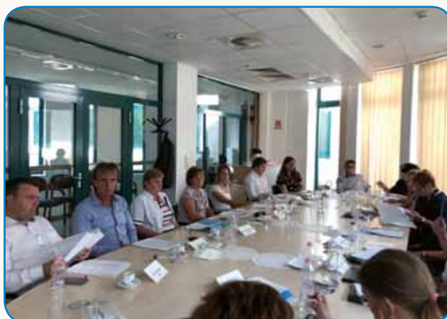
Priprave na mešano komisijo stran 7