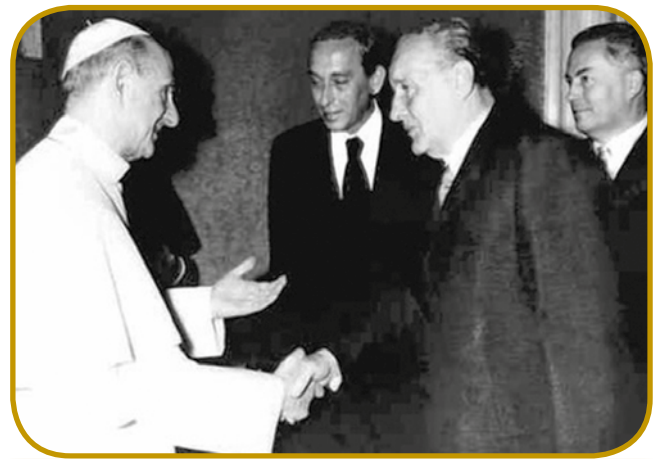
Pápa sveti Pavel VI. je leta 1977 na privatnoj avdienci gorprijo Jánosa Kádára - badva sta bila pripravleniva na kompromis

čijov (NSZK) pa se je diplomatski povezala že leta 1973. Normalizeralo se je partnerstvo z Vatikanom tó, vej so pa kardinali Józsefi Mindszenty dali amnestijo, šteri je tak leta 1971 leko zapüsto rosag. Po imenüvanji nauvoga nadpüšpeka v Esztergomi je hierarhija madžarske katoličankjske cerkve pá cejla gratala, tak je leko leta 1977 János Kádár gorpoisko rimskoga pápo Pavla VI . Gda se je bojna v Vietnamu leta 1973 končala,