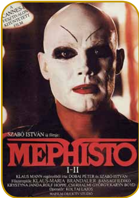
»Mephisto« režisera Istvána Szabóna je biu prvi madžarski film, šteri je daubo oskara za najbaukši film v tihinskom geziki (1982)

bole modernimi štiluši tó. Ro-kenrol ino beat skupine (Illés, Omega, Metro) so na začetki eške dosta problemov mele s