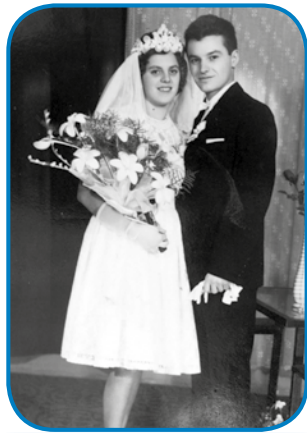
Njeni zdavanjski kejp

krat bijo v tau igri neguš krau, pa te tak je tau ime daubo, ka Neguš«