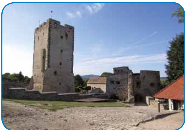
Grad v Nagyvászsonyi so v srejdnjom vōki zozidali na ednom bregej blūzi vretine potoka Eger

Grad od leta 2017 obnavlja-jo, na vsikšom štauki njeg-voga »staroga tōrma« je kakša mala razstava. Leko