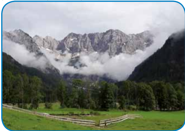
Pogled v meglíce zaviti venec Savinjskih Alp

vküper z ženo Polono Virnik Karničar in tremi mlajšimi, steri že tudi flajсно pomagajo. Istina gé, ka je glavna Polona, stera je tau paverstvo erbala leta 2010. Po ti-