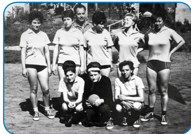
V židano fabriko so go tak goravzeli, če de špilala rokomet (Kati počücnjena prva s prave v prvom redej)

»Te je dobro bilau, gda sem dejkla bila. Dja sem nej vejkla tau, ka te kaj boli, dja sem spoj rada plesala, dostakrat cejlo nauč. Depa k tauma sem mogla najdti tašoga pojba,