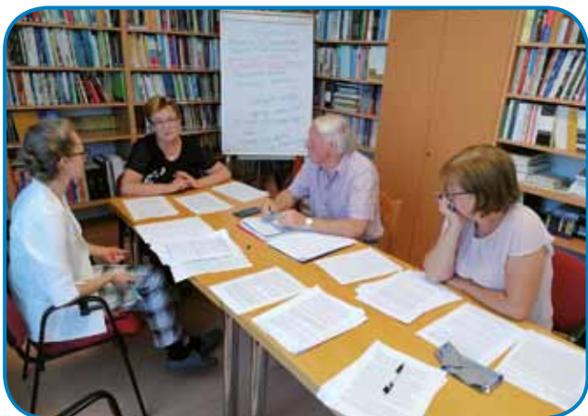
Predhodno usklajevanje v Monoštru v Slovenskem domu