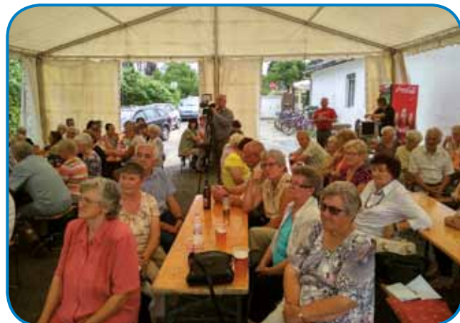
Od 95 članov je prišlo 70

funkcionarov. Dugoletna člani ca vodstva, danešnja pomočnica pa zborovodkinja pevskega