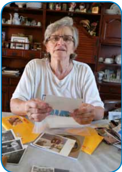
Kati je cejlo svojo življenje živala v Slovenskoj vesi

v židano fabriko odla, doma so pa še velki grünt delali, tak ka zame je že malo časa mejla. Tak ka najja z bratom sta baba pa dejdek goraranila.«