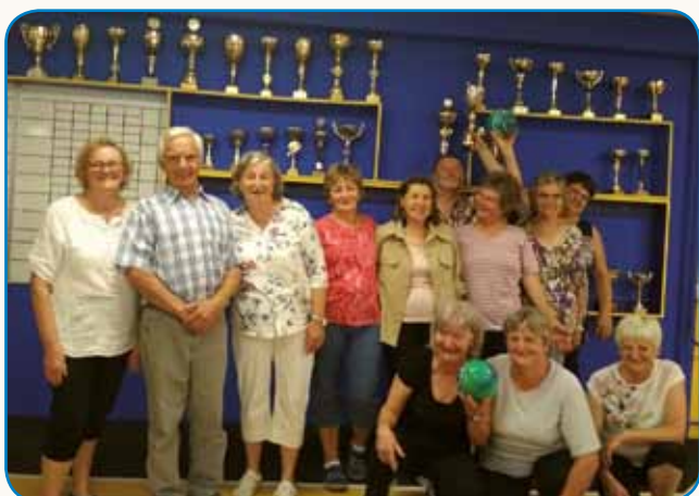
Poletno srečanje s piknikom stran 6