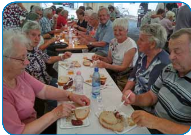
Po občnem zboru so vsakšomi pasale klobase na žaru

štimale. Vsigdar smo se taužili, ka člani neščejo plesati. Hvala Baugi, mamu mlade člane, steri trno radi plešejo. Dapa