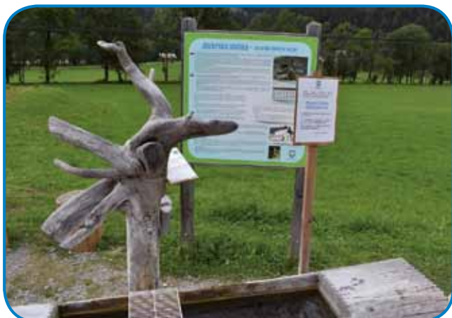
Jezerska slatina je mineralna voda, stera ma v sebi dosta manganovih in amonijevih snovi, zatou jo ške najbolje priporočajo betežnikom na srci in ožilji

stom se je dosta vsega vöminilo. Na gazdiji, na steroj majo osem zidin, so glavni ram, za steroga pravijo, ka je biu zazidani že davnoga leta 1517 (in je zavolo toga tudi zavarovani kak kulturni spomenik državnoga pomena), obnauvili z