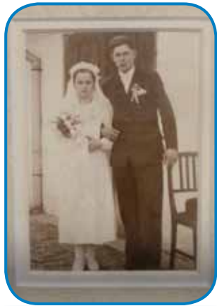
Zdavanjski kejp starišov