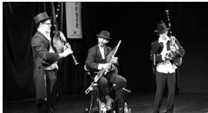
Flamski glasbeniki v Kulturnem domu