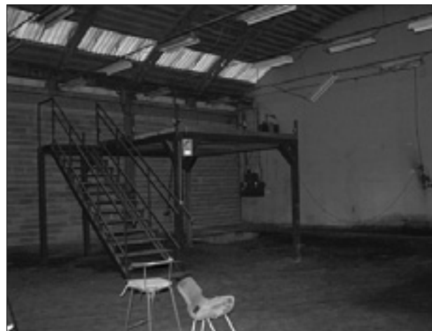
Notranjost kompleksa Mebla A+A (levo); Tomi Ilijaš pred opuščeno proizvodno halo (desno) in njenim vhodom (spodaj)