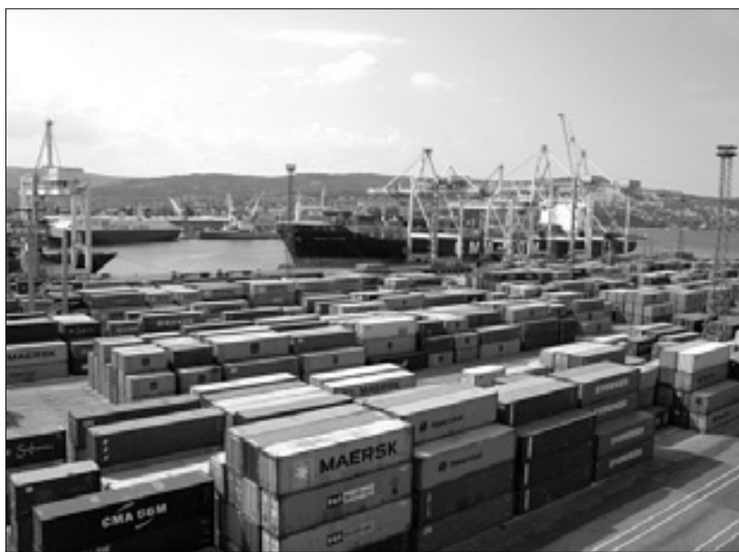
Drugi tir je izredno pomemben za razvoj Luke Koper

LJUBLJANA - Ljubljanski policisti so v sredo v hišni preiskavi pri 32-letniku našli in zasegli 300 gramov heroina, 40 gramov kokaina in okoli 500 gramov prašne snovi za mešanje heroina, so sporočili s Policijske uprave Ljubljana. V hišni preiskavi so našli tu-