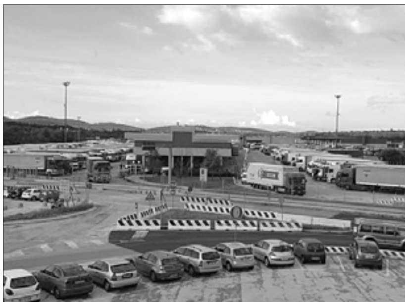
Tovorni terminal pri Fernetičih

Nihče od zaposlenih nima pooblastil za sprejemanje kakršnekoli odločitve. Kljub temu, da decembrske in trinajste plače niso prejeli, se še naprej odpravljajo v službo, kjer pa lahko samo prejemajo telefonske klice (odhodni klici so onemogočeni) in se ukvarjajo z zaostalimi zadevami. Električno zaenkrat kljub vsemu še imajo, a strank ni več. »Ko bi nas kdo odslovil, bi se lahko vsaj vpisali na seznam brezposelnih,« je dejal eden od uslužbencev. Njihovo edino upanje je, da pride čim prej do kakega zasuka. Stečaja doslej še ni zahteval nihče - niti upniki niti tožilstvo. Ko bi do tega prišlo, bi se vsaj malce hitreje zaključilo žalostno in absurdno poglavje, kakršnega zaposleni gotovo ne zaslužijo. (af)