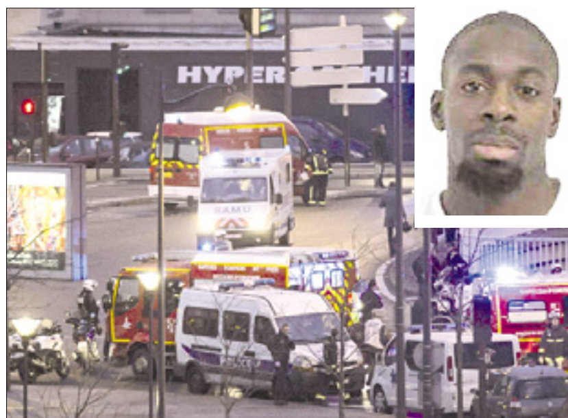
Napadena judovska trgovina v pariški četrti Vincennes in džihadist Amedy Coulibaly

Valls je še dejal, da bodo zagotovili potrebni dodatni ukrepi za odgovor na teroristične grožnje. V skladu z dosedanjimi ukrepi so sicer od avgusta 2013 po njegovih besedah preprečili pet terorističnih napadov.