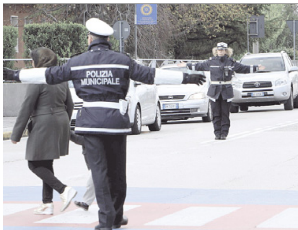
Tržiška mestna redarja

dovoljenega bivanja v mestnem središču, obiskali pa so tudi nekaj nezakonito vseljenih stanovanj v stanovanjskem bloku Tonon v Ulici Rossini in na območju nekdanje diskoteke Hippodrome; nekaj stanovalcev so ovadili sodišču. Mestni redarji so pregledali tudi petintrideset stanovanj in preverili dokumente 200 tujih državljanov; enega