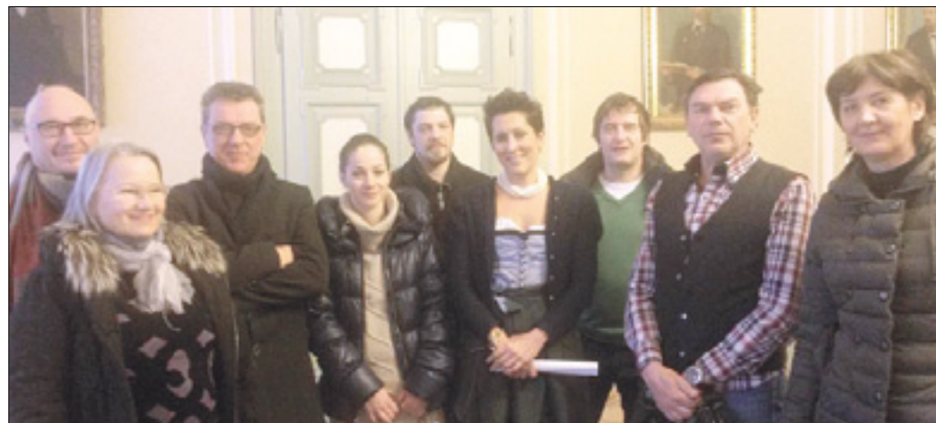
Del sodelujočih gostincev na goriškem županstvu

Pojasnili bodo značilnosti goriškega rdečega radiča in opozorili, po čem se razlikuje od podobnih sort