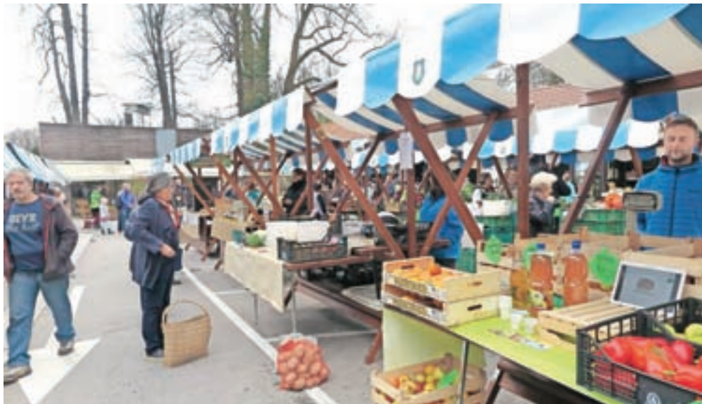
Kamniška tržnica je bogatejša za deset novih pokritih stojnic.

Občina se je tako že maja odločila za prenovo stopnic, saj so bile obstoječe že močno poškodovane zaradi izpostavljenosti vremenskim vplivom, soljenja v zimskem času in mehanskih udarcev. Za novo stopniščno ploščad so v proračunu namenili 47 tisoč evrov. Izveden je bil tudi zaris parkirnih površin, ki bodo obiskovalcem tržnice kot tudi mesta omogočale