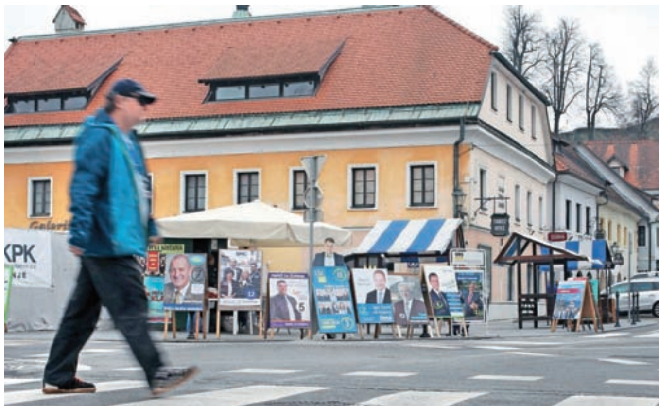
Kdo bodo župan, občinski svetniki in predstavniki krajevnih skupnosti, bomo volivci odločali v nedeljo.

Za župana občine Kamnik se poteguje sedem kandidatov, za devetindvajset mest v občinskem svetu pa dvanajst list oziroma strank.