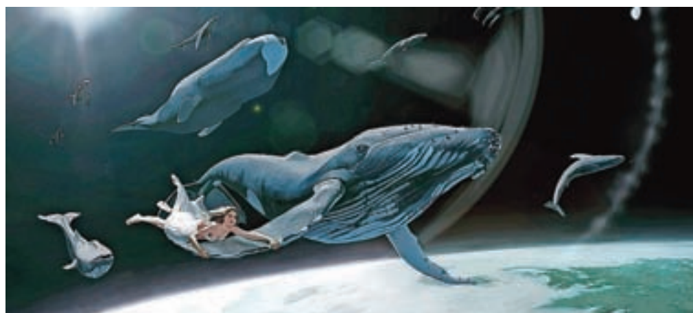
Onkraj sna do zvezd: podobe Urbana Rodeta združujejo usklajenost digitalne forme in domišljajske vsebine.

ban proceduralno izpili med samim procesom ustvarjanja. Slikarska dela nastajajo v digitalnem mediju, za njihov nastanek pa sta pomembni risarsko in slikarsko znanje. Ustvarjanje poteka preko vmesnika – zaslona, ki oponaša hrupnost papirja in je občutljiv na dotik posebnega svinčnika. Tematike del so raznolike, vse od kritike človeškega pohlepa do osebne introspekcije in narave človeškega stanja. Slikovni elementi vsebujejo medsebojno interakcijo, ki je nakazana skozi izbiro barv ali postavitev objektov. Ustvarjene podobe so na meji med fantastiko in surrealizmom, kljub žanrskim omejitvam pa dajejo občutek realizma – ustvarjanje se prilagaja pogledu na svet, obenem pa se prav ta pogled spreminja z razumevanjem ustvarjanja.