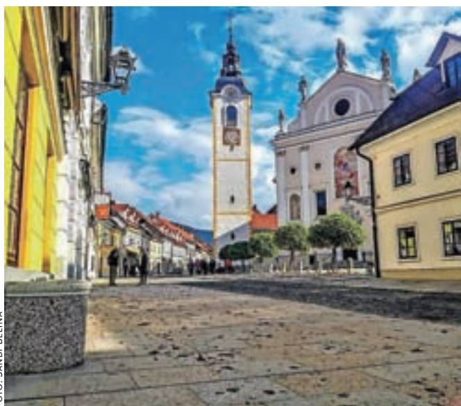
Šutna je največji vir fotografskega navdiha Sandija Beline.