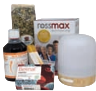
Ideja za darilo - za zimo brez zoprnih zdravstvenih tegob

Najprej naredimo seznam obdarovancev in poleg dopišimo, koliko naj bo vredno darilo za vsakega. Tako bomo hitro ugotovili, kakšen proračun potrebujemo. Potem pa pričnimo zbirati ideje za darila.