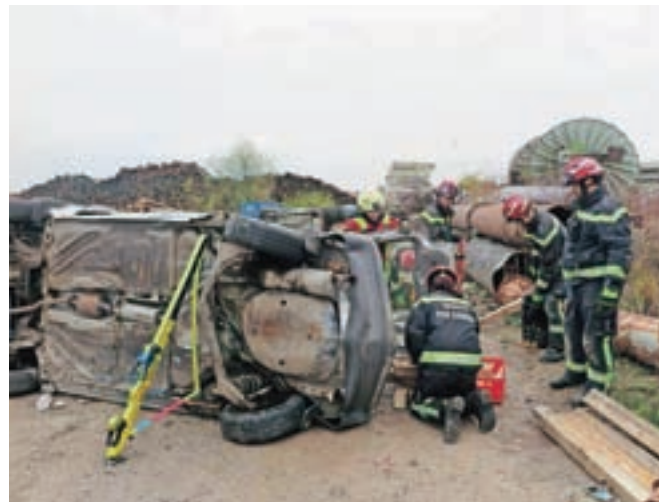
Vozila na strehi, na boku, na skalah ... vajo so želeli kar se da približati stanju pri pravih nesrečah.

Kamniški gasilci, vsi po vrsti prostovoljci, so imeli v lanskem letu 217 različnih intervencij, s čimer se uvrščajo na drugo mesto med prostovoljnimi gasilskimi enotami v Sloveniji. Ker imajo koncesijo za posredovanje v prometnih nesrečah za občine Kamnik, Komenda in Mengeš, je bilo med njihovimi intervencijami tudi veliko prometnih nesreč.