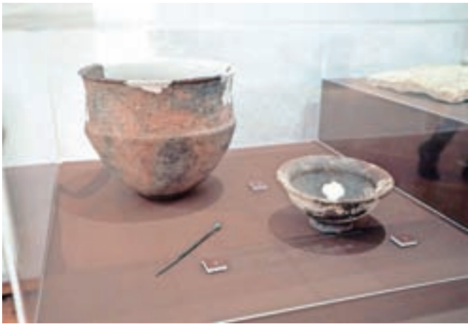
Žarni grob, najden v Kamniku, sodi med najstarejše iz tega obdobja pri nas.

označena s kamnito ploščo,« je takratni pogrebni ritual opisala Janja Železnikar ter poudarila, da je kamniški grob v tem kontekstu še posebej dragocen.