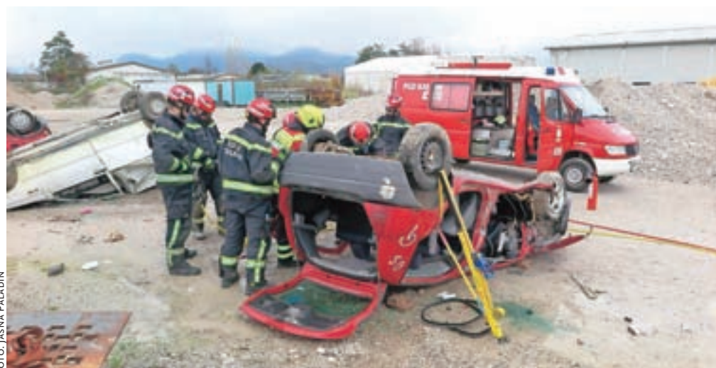
Kamniški gasilci so za posredovanje v prometnih nesrečah dobro usposobljeni.