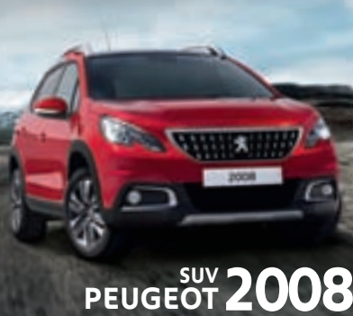
SUV PEUGEOT 2008