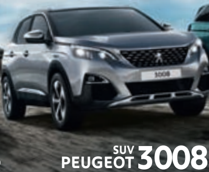
SUV PEUGEOT 3008