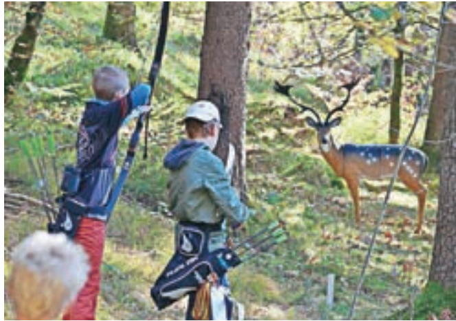
Na progi je bilo postavljenih štirinajst živalskih tarč iz umetne mase v naravni velikosti. / FOTO: FRANCI CEVZAR

Bilo je veliko priprav s samo organizacijo, kajti gozdna trasa, kjer naj bi bile tarče, je bila dobesedno prepredena z vejicami in debli, ostalimi od žledoloma pred leti. Z veliko truda in požrtvovalnostjo članov nam je uspelo progo pripraviti do tekme. Tekmovanje se je odvijalo večji del po gozdu, nekaj tarč pa je bilo vidnih s cestišča, tako da so imeli obiskovalci priložnost videti potek same tekme. Na sami progi je bilo postavljenih štirinajst živalskih tarč iz umetne mase v naravni velikosti.