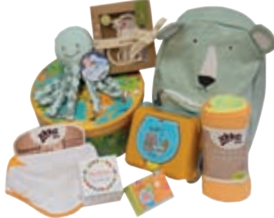
Ideja za darilo - za male sončke in predšolske korenjake

Ob kupovanju daril si bomo prihranili precej slabše volje in živčnosti, če bomo čim več stvari skušali najti na enem mestu. Izberimo trgovino, v kateri bomo našli nekaj za vse generacije, hkrati pa bodo naša darila imela tudi neko rdečo nit. V Beli štacunci boste našli oboje: izdelke za zdravje in nego, namenjene vsem generacijam.