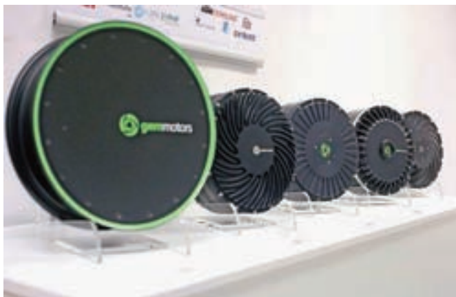
V osmih letih so razvili že pet nadgradenih elektromotorjev.