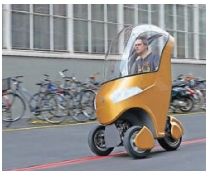
Bicar – mestno vozilo prihodnosti

Bicar je majhno vozilo, težko le 120 kilogramov, ki bi si ga prebivalci in obiskovalci večjih mest izposojali za prevoz po središčih. Zaradi električnega pogona ima za 140-krat manj izpustov ogljikovega dioksida na prevožen kilometer kot navaden avto, je tih, doseže pa lahko hitrost 45 kilometrov na uro. Glede na velikost bi na običajno parkirno mesto lahko spravili šest bicarjev.