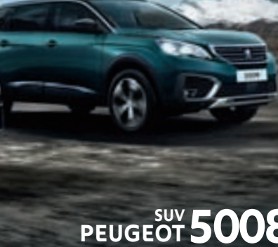
SUV PEUGEOT 5008