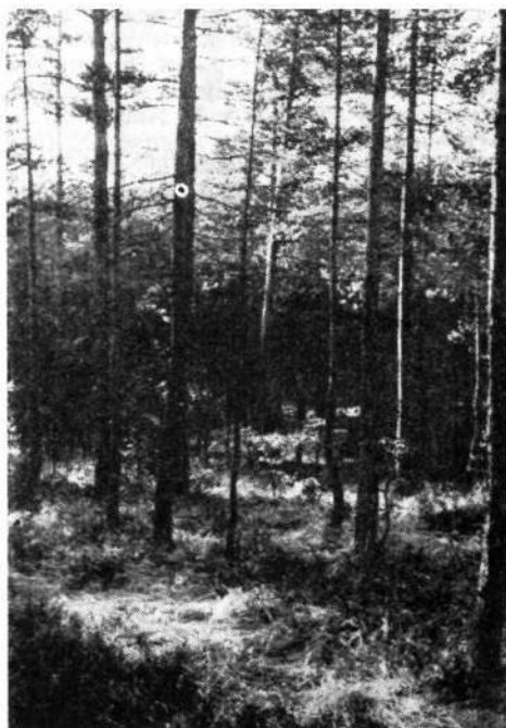
Pogled v borov ( Pinus silvestris ) gozd pod Šentjoštom

Pa pustimo sedaj hribe in se podajmo v ravnino, na skrajni severozahodni rob Sorškega polja, pod Šentjošt v borov gozd ( Pinus silvestris ). Redki borovci