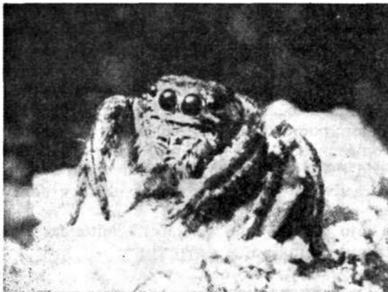
Pajek skakač na preži; lepo so vidne velike sprednje oči (iz F. Lock-a)

kot za pajke. Sicer so pa skakači otroci sonca. Že v prvih pomladnih dneh jih srečamo na sončnih stenah in plotovih, kjer preže na plen s svojimi izredno dobro razvitimi očmi (slika 4). Med vsemi pajki, kar jih živi po zemeljski obli, imajo prav ti ta čutila najboljše razvita. Razporeditev osmih različno velikih oči po glavi omogoča skakačem, da opazijo plen že na četrto metra, pa naj se jim približa muha tudi od zadaj.