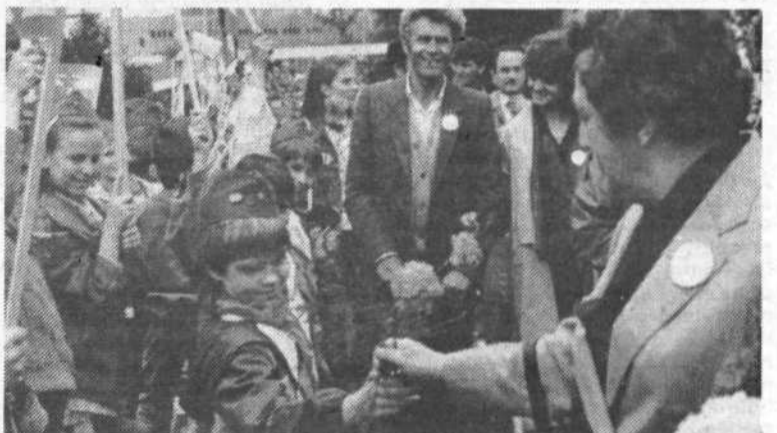
Šest družin je v občini Center gostilo popotnike z Vlaka bratstva in prijateljstva iz Srbije, ki so se mudili pri nas ob 5. do 8. junija. Razkazali so jim Ljubljano, peljali pa so jih tudi na Turjak in Raščico, rojstni kraj Primoža Trubarja. Kot je že običajno pri takih srečanjih so se tudi to pot poglobile stare in spletile nove prijateljske vezi.

— Želimo, da celotna zamisel in akcija postaja postopoma vse bolj dejavnost mladih — skratka, da bi natečaj in prireditev na temo »Revolucija še traja, kje je naše in moje mesto v njej«, postala resnično sestavni del aktivnosti mladih ter njihove organizacije.