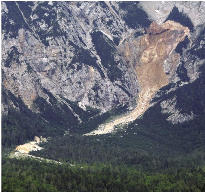
Slap Čedca julija 2008.

ime po mokrenju kobile? Trentarjev slap boste zaman iskali v Zgornjem Posočju, saj je na Pršjaku, enem od pritokov Trebuščice na zahodni strani Vojskarske planote. Kot imajo "vsake oči imajo svojega malarja", tako prepričamo tudi bralca vodnika, da si poišče sam svojega favorita ali sestavi lestvico "top 5". Če vas zanimajo podrobnejše geološke značilnosti slapov, boste morali vzeti v roke dodatno čtivo. To pa je vsekakor pretežko, da bi ga nosili s seboj v naravo, kot to lahko storite z novim vodnikom. Vodnik dopolnjujejo kakovostne fotografije in pregledni zemljevidi širšega območja posameznega slapu, na katerih je vrisan potek poti.