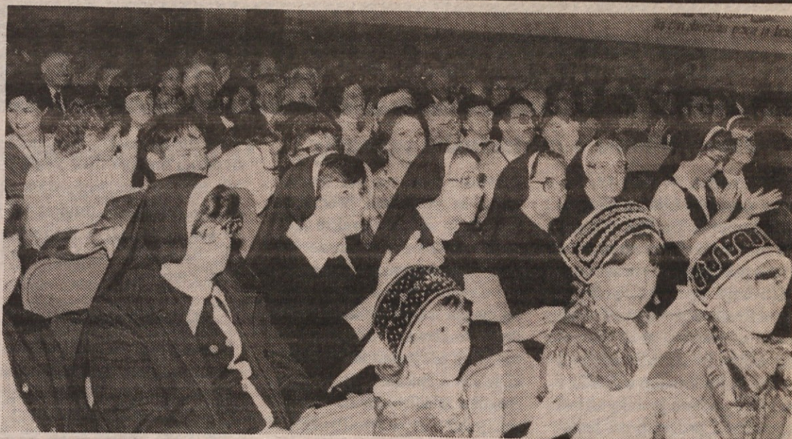
NA SLOVENSKEM DNEVU V CHICAGU! Preteklo soboto so čikaški Slovenci praznovali svoj Slovenski dan. Dvorana sv. Štefana je bila zasedena, med navzočimi je bilo tudi več Clevelandčanov, ki so prišli skupaj z god-

- Kaj pa naj bi ušpilal, če sem vseh 5 ur v kotu preklečal.