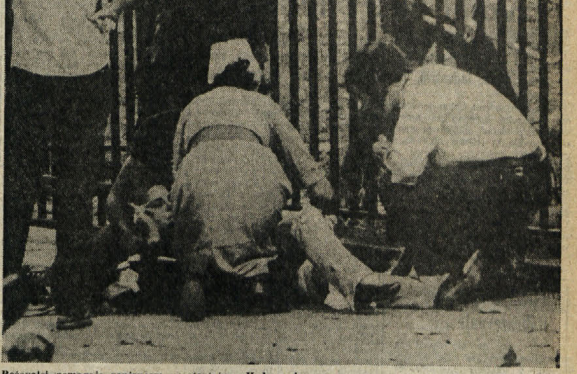
Reševalci pomagajo ranjenecem po atentatu v Hyde parku

TEHERAN, BAGDAD — Puščavsko območje severno od pristanišča Basre je bilo tudi včeraj prizorišče ogorčenih bojev med iraškimi in iranskimi oboroženimi silami. Protislovna vojaška sporočila obeh strani vztrajno poudarjajo uspehe zdaj iraških ali iraških čet, ne omenjajo pa števila lastnih izgub, da je kljub temu jasno, da so razsežnosti medsebojnega pokola strahovite.