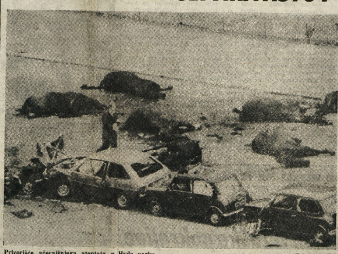
Prizorišče včerajšnjega atentata v Hyde parku

Bombi sta eksplodirali v Hyde parku med sprevedom kraljeve straže in v Regents parku med koncertom neke vojaške godbe - Vse žrtve so bili pripadniki vojske