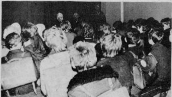
Prenašanje tradicij NOB na najmlajše rodove je ena najpomembnejših nalog članov ZZZB NOV. Iz srečanja borcev in mladine v Šmartnem na Pohorju.

O doseženih rezultatih so člani organizacije ZZZB NOV spregovorili pred nedavnim tudi na skupščini ZZZB NOV bistriske občine. Ob tej priložnosti so kritično ocenili preteklo obdobje aktivnosti na osnovi doseženih uspehov in stalnih nalog pa so sprejeli tudi delovni program za prihodnje mandatno obdobje. V programe dela so vključili tudi mnoge naloge, ki izhajajo iz programov razvoja družbenopolitičnih in gospodarskih organizacij okolja v katerem živijo in delujejo kot tudi celotne občine Slov. Bistrica. Med najpomembnejšimi nalogami prihodnjega ob-