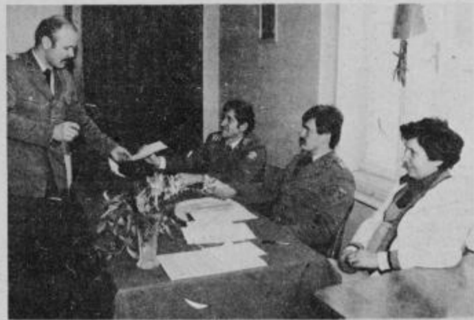
V četrtek, 11. marca so izvolili svoje delegate tudi delavci Postaje milice Ptuj.