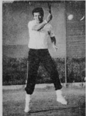
Tenis ima tudi v Ptuj veliko privrženecv

članarina precej visoka, zlasti za starejše člane, ti plačajo namreč 1500 din. Od tega je 500 din kavelja za 10 ur prostovoljnega dela pri urejanju in vzdrževanju ter pri bližnji izgradnji novih igrišč. Članarina za mladince je 500 din, za pionirje pa 200 din na leto. Plačana članarina pomeni brezplačno uporabo igrišč s katerimi upravljamo, prav tako pa tudi prosti vstop s tem, da to ne smemo izrabljati za uporabo