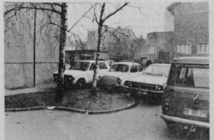
Parkirani avtomobili so povsem zaprli pot pešcem.