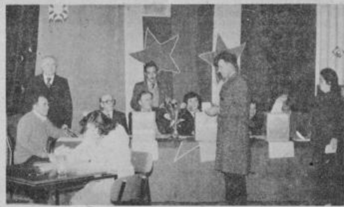
Med najbolj urejenimi je bilo volišče v kulturnem domu v Apačah