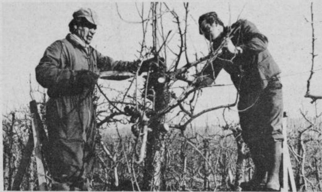
Od strokovno opravljene rezi je v marsičem odvisna kakovost in količina pridelka.