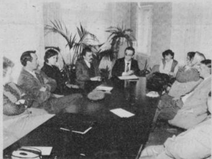
Pred začetkom razprave je bil prejšnji teden na komiteju OK ZKS Ptuj delovni razgovor z delegati.

Na vseh razpravah tudi sodelujejo delegati, izvoljeni za 9. kongres ZKS (iz občine Ptuj jih je 13), ki jim bo vsebina razprav dobro napotilo za njihovo delo na 9. kongresu ZKS.