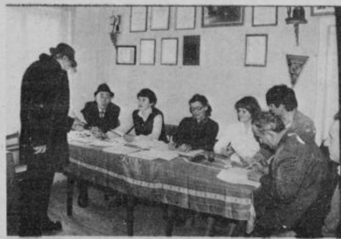
Volilni odbori pri delu gasilcev na Selah.