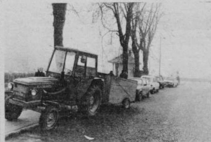
Parkiranje na prehodu za pešce — zgovoren dokaz naše voziške (ne)odgovornosti.