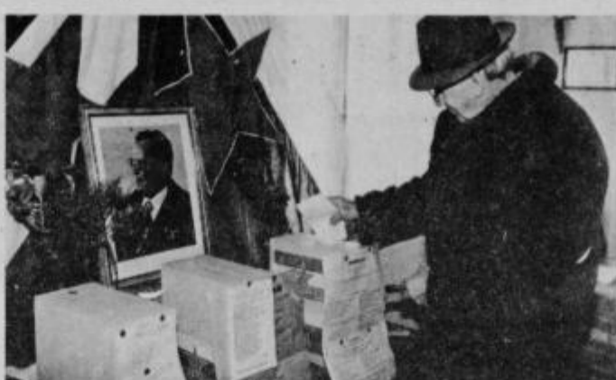
Na voliščih je bilo treba paziti, da je volilec dal vsako glasovnico v ustrezno volilno skrinjico.

Povsod so bila volišča lepo okrašena; tu in tam pa je glasba mešala vrvež. Občani ptujskih krajevni skupnosti: Bratje Reš, „Olga Meglič“, Franc Osojnik in Boris Ziherl so že v zgodnjih dopoldanskih urah imeli visoke odstotke volilne udeležbe. V krajevni skupnosti „Olga Meglič“ je volilna udeležba že ob 9. uri bila med 40 in 50-timi odstotki, v istem obsegu so bili odstotki udeležbe v krajevni skupnosti „Bratje Reš“,