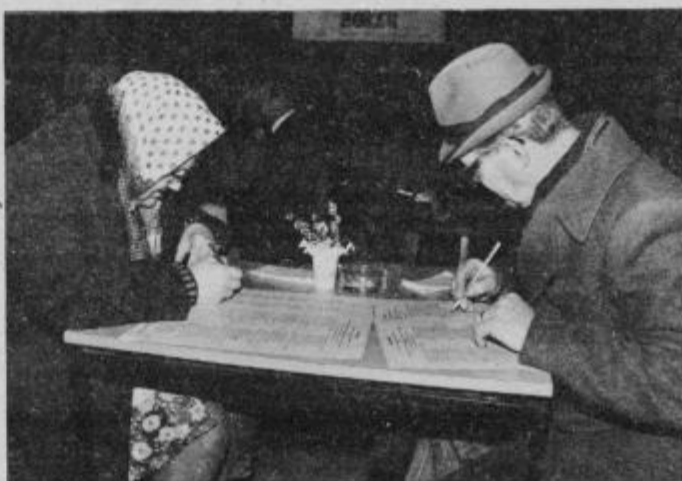
Glasovnice s kar desetimi posebnimi delegacijami za zbornice uporabnikov SIS so zlasti starejšim ljudem dajale precej dela, da so pravilno obkrožili kandidate.

Poslužili pa so se še druge možnosti — nekaj takih tradicionalnih zamudnikov so uspešno vključili v neposredno delo na volišču in se tudi tako izognili nepotrebnemu čakalju. Zgovoren je primer iz območja krajevne skupnosti Juršinci, kjer je „prevzgoja“ delovala tako uspešno, da je letos tak tradicionalni zamudnik opravil svojo dolžnost že pred deveto uro zjutraj.