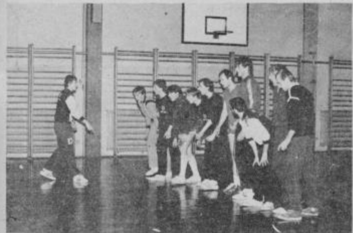
Pozdrav ptujске ekipe pred srečanjem