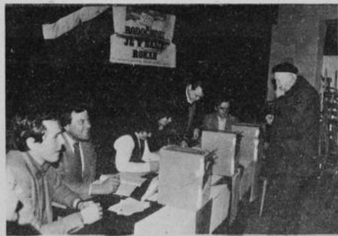
Na volišču v prosvetni dvorani v Hajdini.