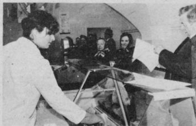
Prvi kupci v novi prodajalni „RIBA“, v sredo, 17. marca so bili nad izbiro izredno zadovoljni.

Če želite vam izdati še to: od zmrznjenih rib lahko kupite zubatca, lignje, škarpine, škampe, osli-