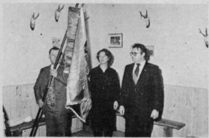
V lovskem domu v Sobotincih so borci KO ZB NOV Markovci razvili svoj prapor.

Čas neusmiljeno teče in naši člani so povečini že ljudje v visokih življenjskih letih, zato nas je vsak dan manj. V zadnji mandatni dobi smo jih izgubili 8, od teh letos dva člana UO. Poudarili pa smo, da najtežje občutimo izgubo našega najdražjega soborca, tov. Tita, vendar zaradi tega nismo malodušni. Še naprej bomo hodili pod njegovo — Titovo zastavo. Z enominutnim molkom smo počastili spomin na vse preminule so-tovariše.