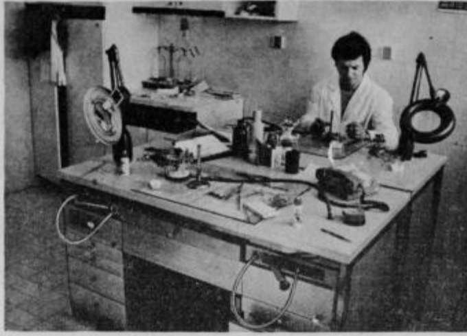
V zobnem laboratoriju