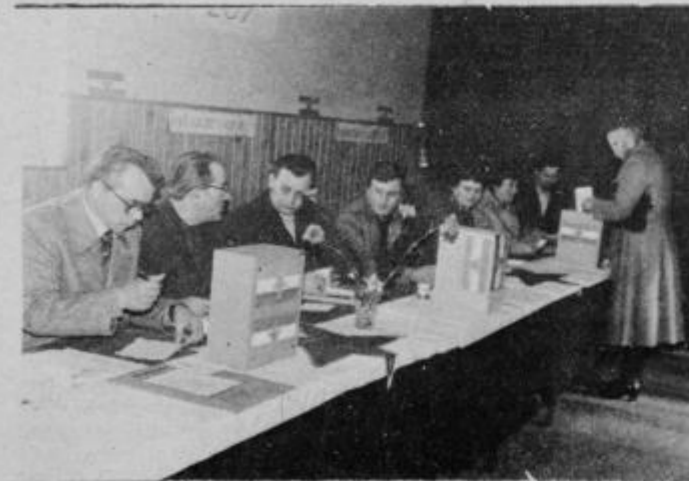
Na volišču v domu občanov Turnišče.