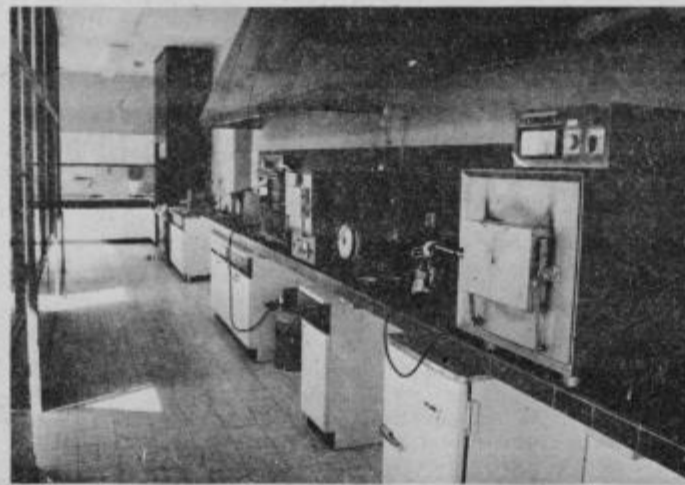
Vilvnica v ptujski zobni ambulanti

matološke smeri in je že pet mladih deklet v ptujski občini trenutno brez zaposlitve. Nekateri so bile tudi stipendistke, vendar jih ne moremo zaposliti, saj začasno ne smemo odpirati novih ambulanz.