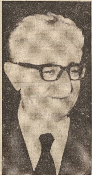
Predsednik republike Leone