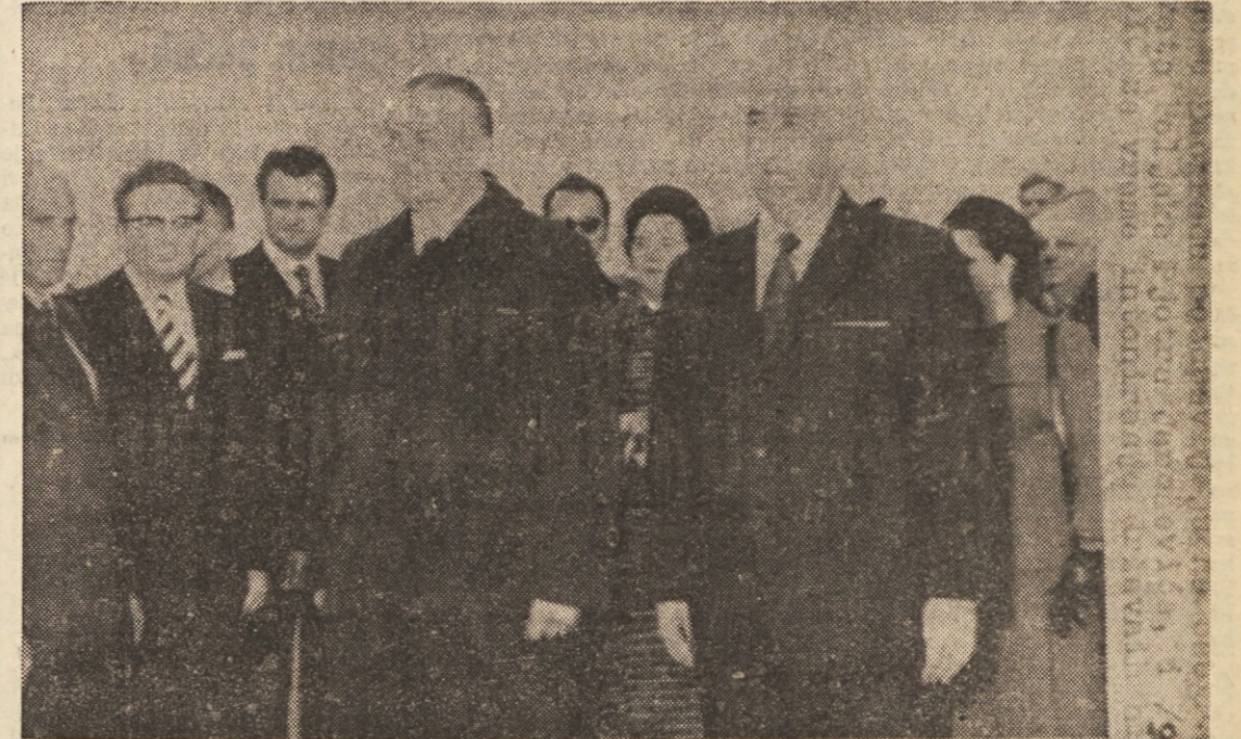
Poljski premier Jaroszewicz (levo) s predsednikom zveznega izvršnega sveta Bijedičem na beograjskem letališču