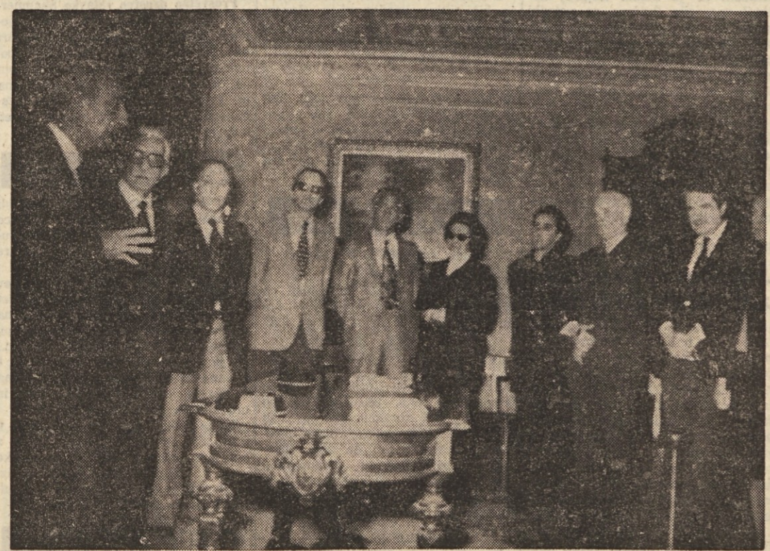
Veraž, na predvečer svečanega odprtja Rižarne, nacionalnega spomenika in edinega uničevalnega taborišča v Italiji, se je sestel na izredni seji vsestranski odbor združenja bivših političnih deportirancev ANED skupno s člani pokrajinskega odbora omenjenega združenja. Poročilo objavljamo na 2. strani. Na sliki tržaški župan izreka tople pozdrave in dobrodošlico pred začelom seje v sinji dvorani občinske palače.

Po zaključku ogleda bo v II. nadstropju muzeja predsednik republike Giovanni Leone sprejel najprej delegacijo slovenske narodnostne skupnosti, ki mu bo izročila pismo, v katerem so zajete zahteve Slovencev za ureditev njihovega položaja na podlagi ustavnih določil, ki so izšla iz skupnega boja proti fašizmu. Predsednik bo nato sprejel še delegacijo odlikovancev z zlato me-