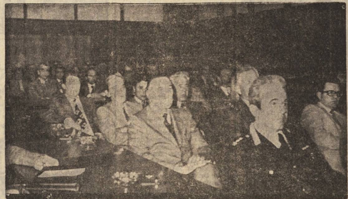
Udeleženci proslave 30-letnice osvoboditve v sejni dvorani goriske pokrajine.

ENALOTTO, sreča slehernega sobotnega večera.