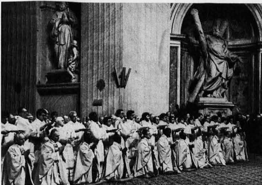
Polaganje evangelija med obredom škofovskega posvečenja na glave novih škofov v baziliki sv. Petra na praznik Razglašenja Gospodovega. Prvi od desne, ki kleči, je novi goriški nadškof

V NEDELJO 30. JANUARJA BOMO PRAZNOVALI NEDELJO KATOLIŠKEGA TISKA VELIKODUŠNO PRISPEVAJMO!