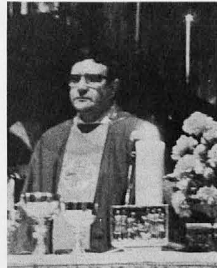
Novi goriški nadškof p. Anton Vital Bommarco med mašo, ki jo je opravil v petek 7. januarja v baziliki Svetih apostolov v Rimu za goriške vernike

V sredo 5. januarja zjutraj ob šestih smo bili že na avtocesti pri Ronkah. Ker je bil avtobus nov in udoben, je bila vož-