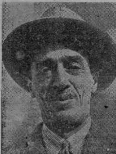
Vojvoda Alba, španski nacionalistični poslanik v Londonu. Imenovanega se hoče poslužiti Anglija za posredovanje v španski državljanski vojni