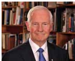
David Johnston novi kanadski generalni guverner

Kanada dobila novega generalnega guvernerja – 1. oktobra 2010 je kanadsko generalno guvernerko Michaëlle Jean zamenjal novi generalni guverner 69-letni David Johnston, odvetnik in akademik, ki je bil pred nastopom te funkcije poddekan Univerze v Waterlooju. Kot je povedal v inavguralnem govoru, se bo še posebej prizadeval za podporo družinam in otrokom ter pospeševanje izobrazbe, inovacije in volunterizma.