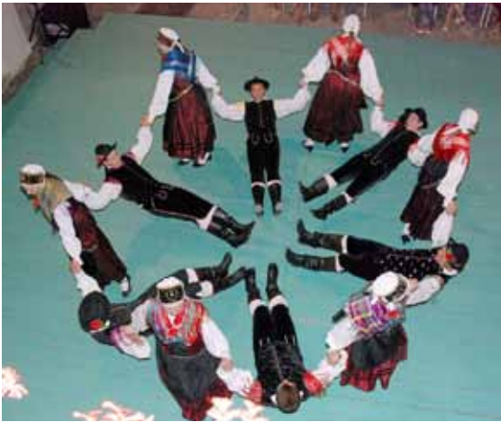
Nastop v Metliki

faces of the all the audience members. They were clapping, yelling, shouting, whistling and singing during the entire performance. Thunderous applause and jovial faces greeted us during our entire tour. Our performance in Metlika was very emotional. That night we had our closing performance in the spacious arcaded inner courtyard of the castle. No one wanted this tremendous opportunity to end. It was hard to imagine that what had started 2 weeks earlier and consumed 2 years of preparation and hard work was drawing to a close.