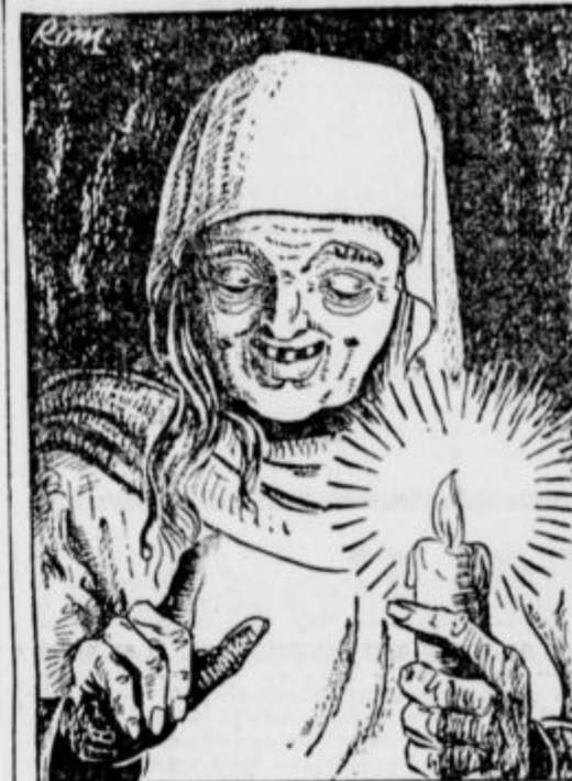
TRETJA PA REČE: »JAZ MU DAJEM ZA ZENO HČERKO, KI SE JE DANES RODILA KRALJU, KATERI LEŽI TU MED NAMI V SENU!«