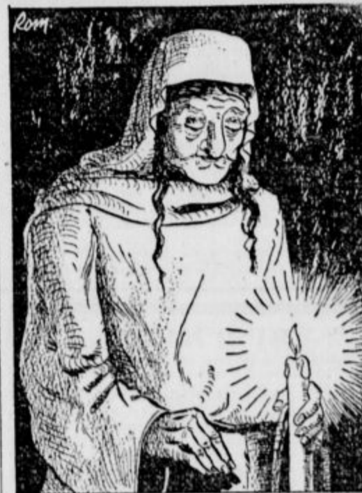
DRUGA PA NATO: »JAZ PA, DA JIH PREMAGA IN SE DOLGO ŽIVI.«