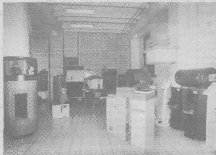
Na sliki je prizor z ene izmed številnih razstav, ki so jih pripravili y demonstracijsko svetovalnem centru na letališki 1