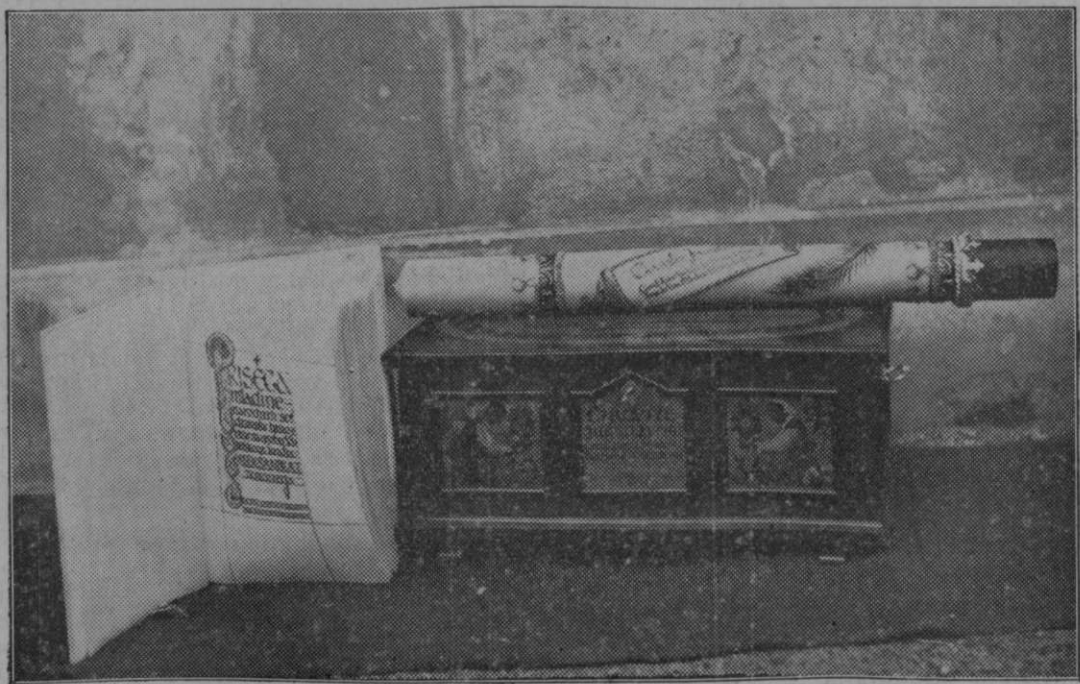
Skrinja v kateri bodo hranjene knjige pergamentov. Poleg skrinje leži sveča, ki bo prižgana v imenu 180.000 otrok.

a) pedagogiko ter stanovske in šolske zadeve, b) mir med narodi.